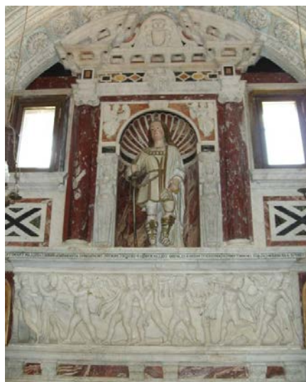
Fig. 2 - El altar de S. Saturnino en el «Santuario de los Mártires» del Duomo de Cagliari.

San Saturnino es el patrón de Cagliari y se celebra el 30 de octubre.