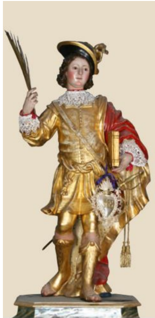
Fig. 3 - Duomo de Cagliari, altar de S. Isidoro: estatua de S. Saturnino.