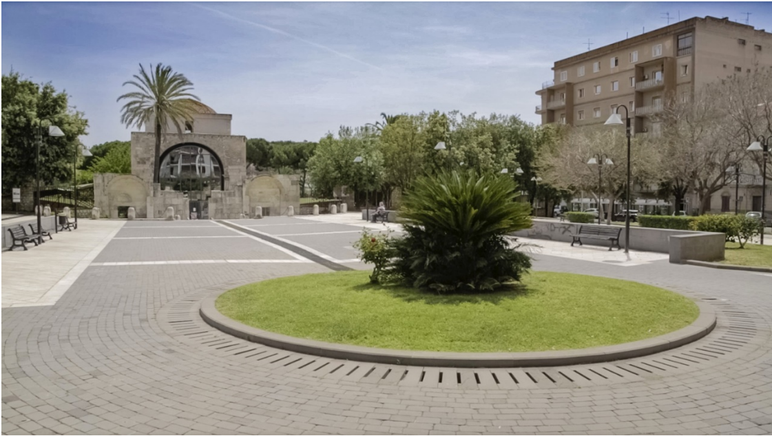
Fig. 1 - Plaza Sa Cosimo: el pozo se encontró en el lugar donde se encuentra el parterre en la actualidad.