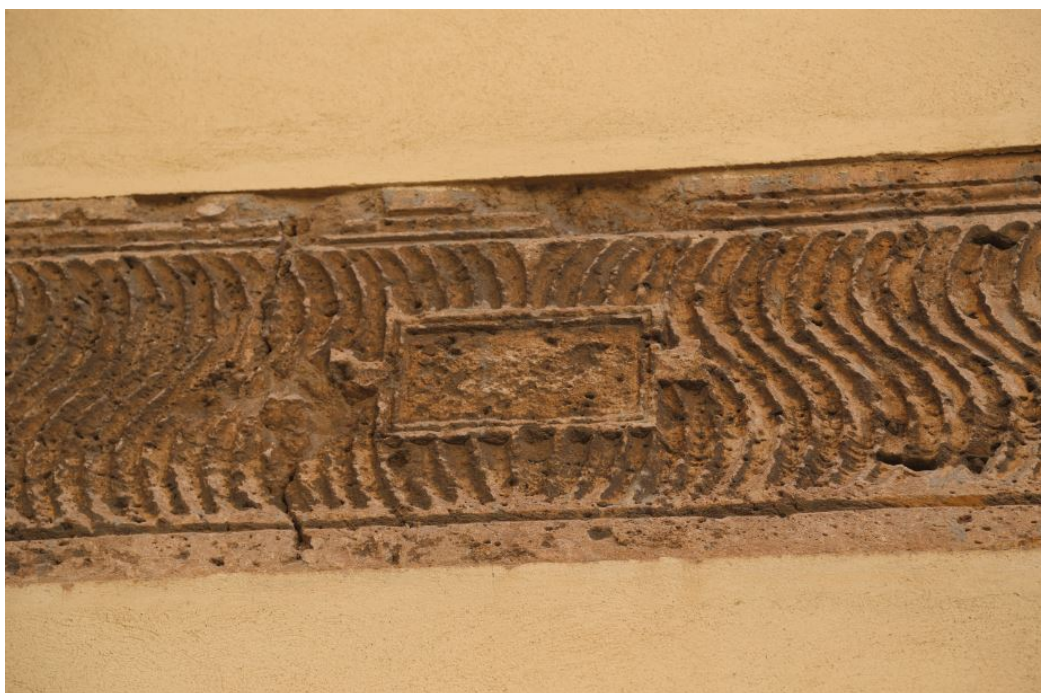
Fig. 3 - Sarcófago estrigilado con tabula con asas.