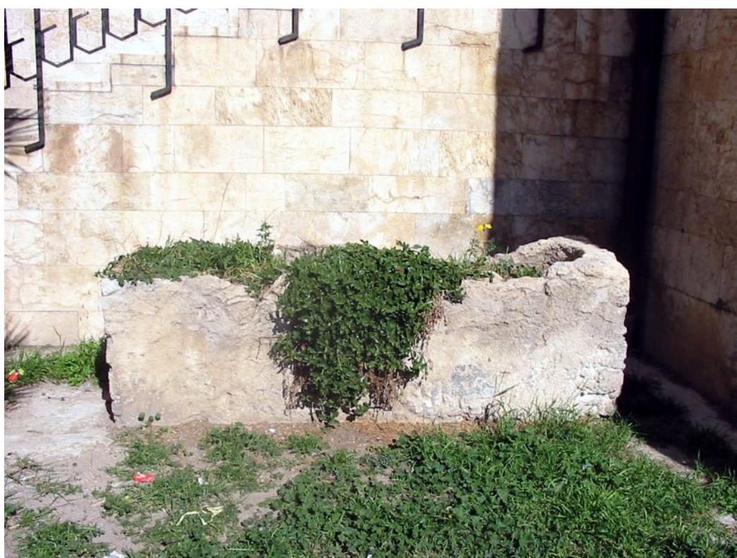
Fig. 4 - Sarcófago de caja (foto de Unicity S.p.A.).