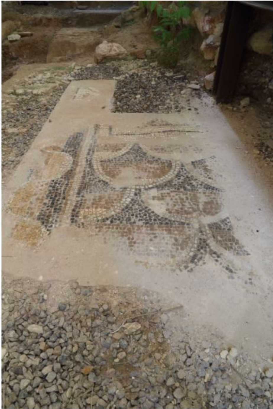
Fig. 1- Mosaico de un suelo decorado con escamas superpuestas.