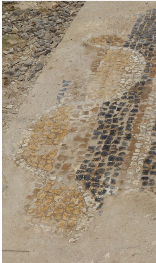
Fig. 2 - Mosaico de un suelo: marco con motivo de ondas.