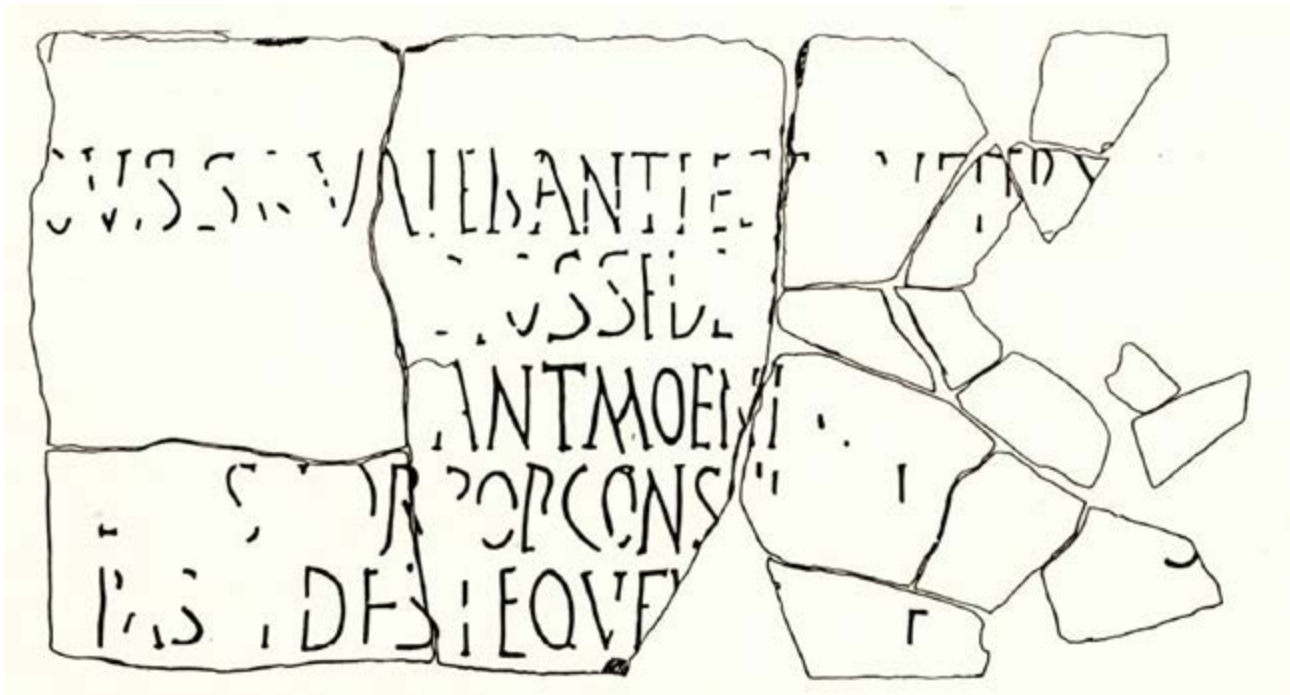
Fig. 2 - Reconstrucción gráfica del epígrafe: cara en la que se lee el término moenia (de Sotgiu 1990, pág. 208, fig. 2).

Sin embargo, la cara que estuvo hacia la tierra durante varios siglos (fig. 3), muestra un texto que se puede datar 6 : Salvis d(ominis) n(ostris tribus) Flaviis Gratiano, V[alentiniano / The]odosio, invictissimis princip[ibus. Thermae] / aestivae quae olim squalor[e et magna] / ruina fuerant conlapsae a [fundamentis (?)] / constitut[ae] nunc de fonte du[---] es decir, restauraron las termas de verano que habían sido destruidas desde hacía tiempo durante la época en la que Graciano el Joven, Valentiniano y Teodosio (379-384) fueron emperadores 7 .