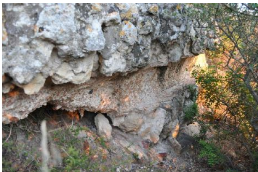
Fig. 5 - Trazado del acueducto (de Fantauzzi, De Vincenzo 2013, pág. 3, fig. 3).

Los hallazgos de pruebas de las termas de verano son muy raras y la integración propuesta en el epígrafe de Cornus ([ Thermae ] / aestivae ) podría derivar de un pasaje de la obra Historia Augusta , según la cual Gordiano III hizo construir una sui nominis alrededor del año 240 14 . Desde el momento en el que se ha propuesto que las estructuras que se han interpretado como las termas en Columbaris datan del siglo III, de forma análoga a las que mandó construir el emperador, se podría hipotetizar una difusión de este tipo de instalaciones en el mismo siglo 15 .