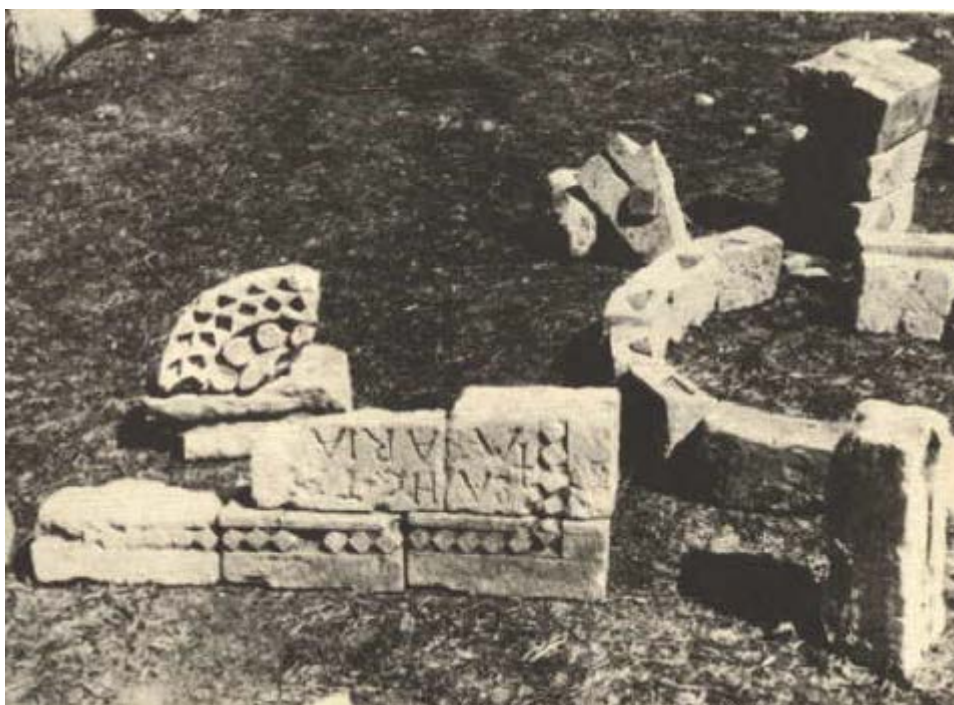
Fig. 3 - Elementos arquitectónicos: en primer plano se observa parte de la inscripción (de Maetzke 1971, pág. 335, fig. 18).