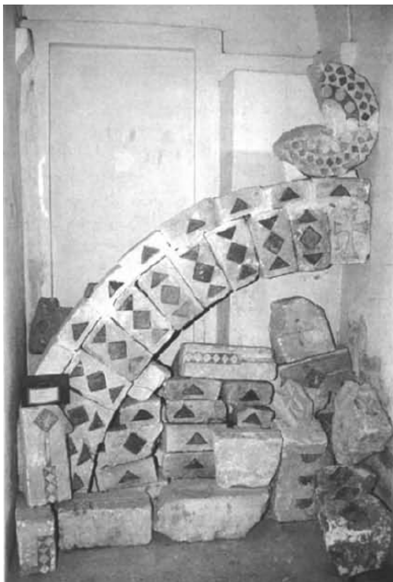
Fig. 5 - Elementos arquitectónicos de caliza con grabados geométricos en traquita roja (de Spanu 1998, pág. 103).

Por último, también se han hallado elementos de la decoración escultórica, como capiteles-imposta, ménsulas con hojas de acanto, un capitel con peces, una ménsula bosquejada en el dorso de una estatua y un capitel-imposta en cuya cara larga luce la decoración del objeto en el que se ha realizado 16 .