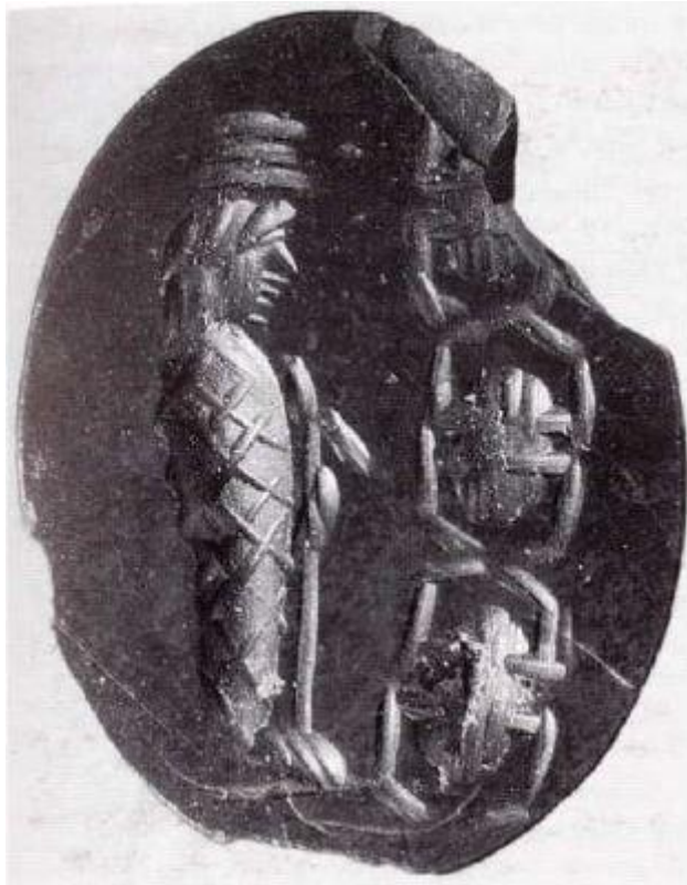
Fig. 5 - Terralba (OR): Gema mágica (de AGUS 2002, pág. 33, fig. 3).