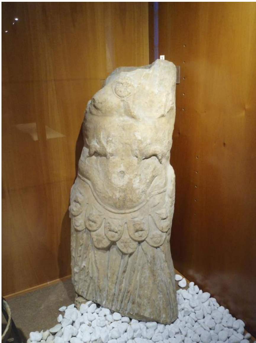
Fig. 1 - Oristano, Antiquarium Arborense : estatua loricata de Cornus.

En el área donde se identificó el foro de la antigua ciudad de Cornus, en el año 1859 se halló de forma fortuita un busto de estatua loricata (figs. 1-2). La plaza de la ciudad romana está ubicada sobre una llanura hacia el sureste de la colina de Corchinas, en la localidad de Campu 'e Corra, y se ha identificado de esta forma por la cercanía con la acrópolis de la misma localidad, además de por el descubrimiento de un mosaico, tres epígrafes y dos estatuas: una de la emperatriz Vibia Sabina y la otra la de la coraza