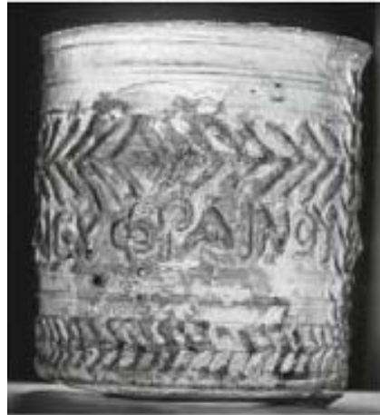
Fig. 3 - Florencia, Museo arqueológico (inv. 91583): vaso de producción chipriota (da CIAPPI 2014, p. 145, fig. 60).