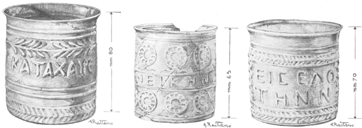
Fig. 1 - Representación gráfica de los vasos de Cornus (de HARDEN 1935, lám. XXVII).

Los tres ejemplares datan del siglo I d.C.508 y cuentan con las mismas características formas aunque se diferencian entre sí por la decoración y la fórmula escrita.