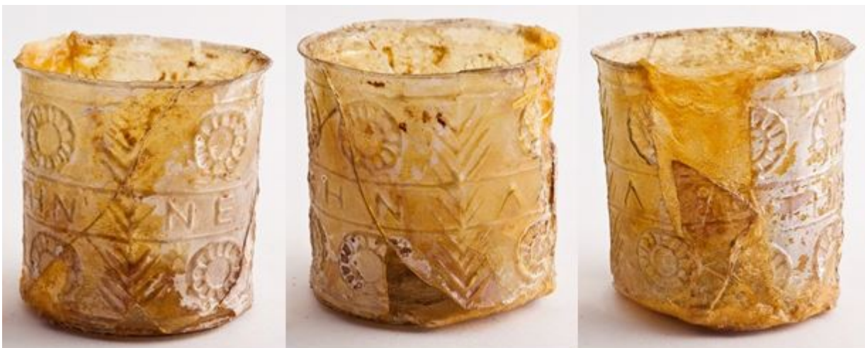
Fig. 5 - Cagliari, Museo arqueológico nacional: vaso cilíndrico, de Cornus.

El tercer objeto (fig. 6) data del siglo I d.C.516 y presenta el texto ΕΙΣΕΛΨΩΝ ΛΑΒΕΤΗΝ ΝΙΚΗΝ «entrando, toma la victoria» en dos líneas que, además, incluye dos franjas de hojas de palma. La inscripción está separada por dos hojas de palmas colocadas en vertical desde el borde hasta el fondo, ocultando las marcas de la matriz. Dos láminas en relieve destacan el borde y el fondo plano. D. B. Harden ha enmarcado el objeto de vidrio en un grupo