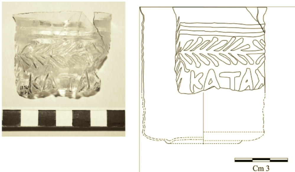
Fig. 4 - Copia/Thurii, área funeraria fuera de la Puerta Norte: fragmento de vaso con la inscripción Kata[chaire kai Euphrainou] (de D'ALESSIO, LUPPINO 2012. pág. 357, fig. 4).

En el segundo ejemplar (fig. 5), con vidrio amarillo-anaranjado, la inscripción ΛΑΒΕΤΗΝ ΝΕΙΚΗΝ «toma la victoria» está enmarcada por dos series de círculos concéntricos unidos por líneas de rayos en la primera y en la tercera franja: D. B. Harden lo atribuye a un grupo del que también forman parte dos ejemplares idénticos porque fueron creados por el mismo molde procedente de Chipre, que se conservan en el Museo Británico. Se ha