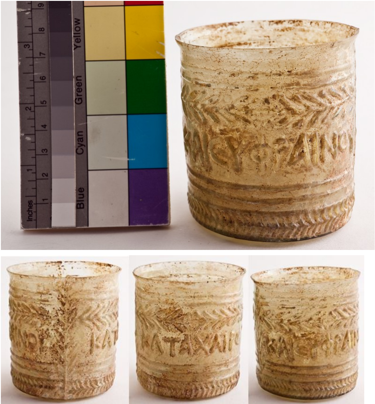
Fig. 2 - Cagliari, Museo arqueológico nacional: vaso con inscripción, de Cornus (col. Gouin), (foto de N. MONARI- RA_00163375/R.A.S.).

mitad del siglo I d. C., que pertenecerían a las áreas de Líbano, Palestina, Chipre y Siria. Se han hallado en varias zonas del centro-norte de Italia (fig. 3), mientras que el único caso conocido hasta ahora hallado en el sur (además del sardo), ha sido en Calabria, en Copia (fig. 4), la actual Sibari.