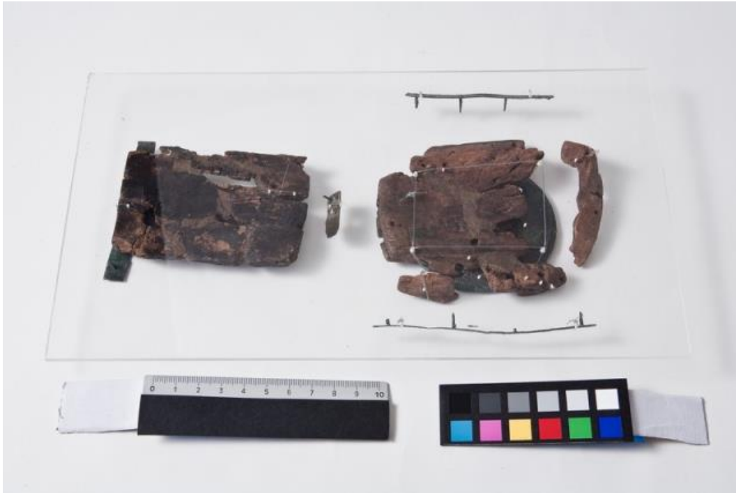
Fig. 2 - Estuche de corcho y espejo de bronce.

El objeto está caracterizado por un disco de bronce con una cara cóncava sin decoración (fig. 3). Forma parte del tipo "de caja" que usaban desde la era etrusca.