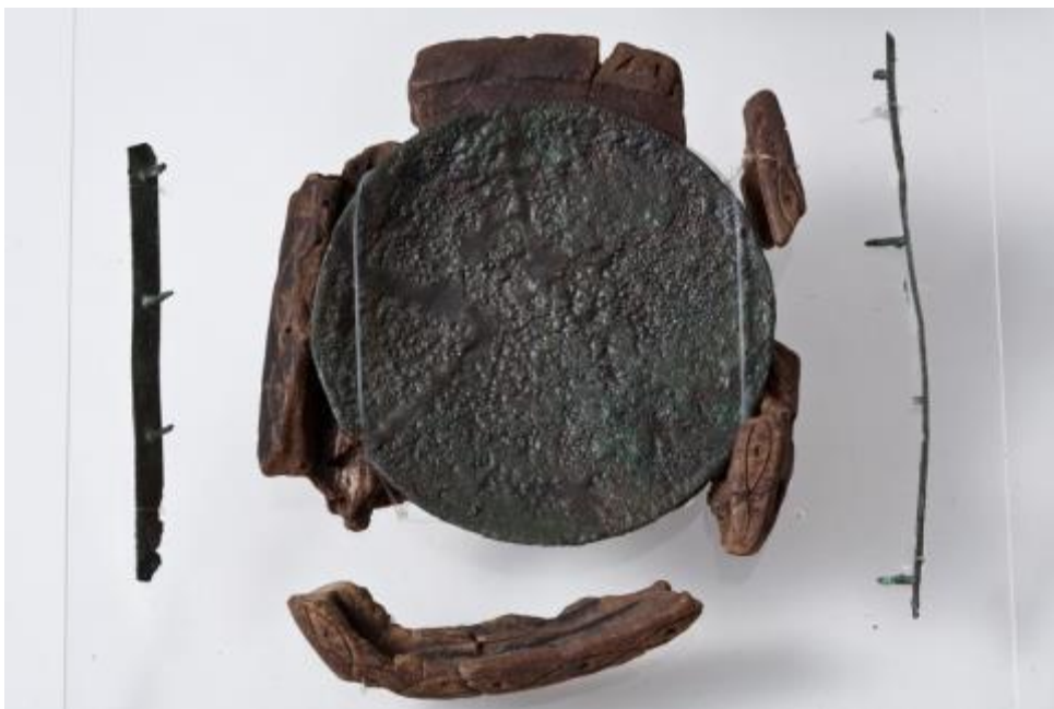
Fig. 3 - Espejo de bronce.

El objeto está caracterizado por un disco de bronce con una cara cóncava sin decoración (fig. 3). Forma parte del tipo "de caja" que usaban desde la era etrusca.