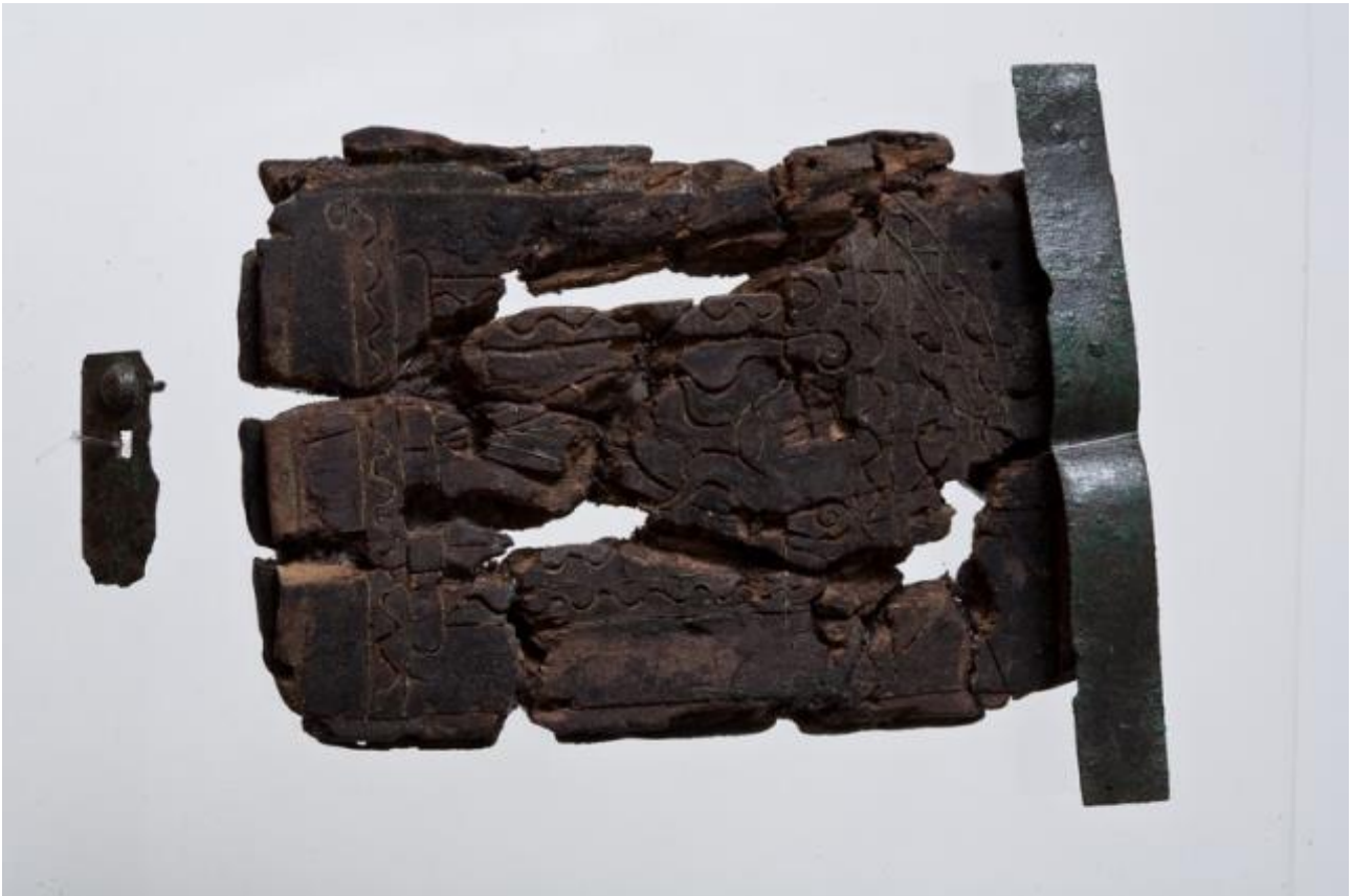
Fig. 4 - Tapa de corcho con adornos.