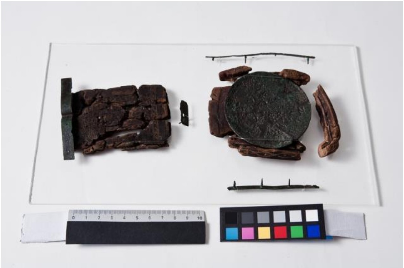
Fig. 1 - Estuche de corcho y espejo de bronce.