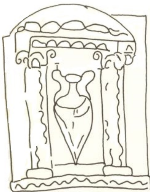
Fig. 5 - Representación gráfica de la decoración sobre el estuche de corcho (de MARTORELLI 2005, pág. 29, fig. 3).

El objeto representa un unicum , tanto por el material como por el motivo decorativo grabado sobre la tapa. Este último también se ha identificado en otros objetos de ámbito funerario, como en losas, pero también aparece de forma esporádica en otros de uso común. Se ha hipotetizado que dicha representación no hace referencia a un momento de la vida real, sino que tiene un valor simbólico. La forma del ánfora parece indicar la unión de elementos procedentes de algunos contenedores de transporte que circulaban por el Mediterráneo occidental, en particular entre los siglos IV-VI d.C. (véase fig. 6).