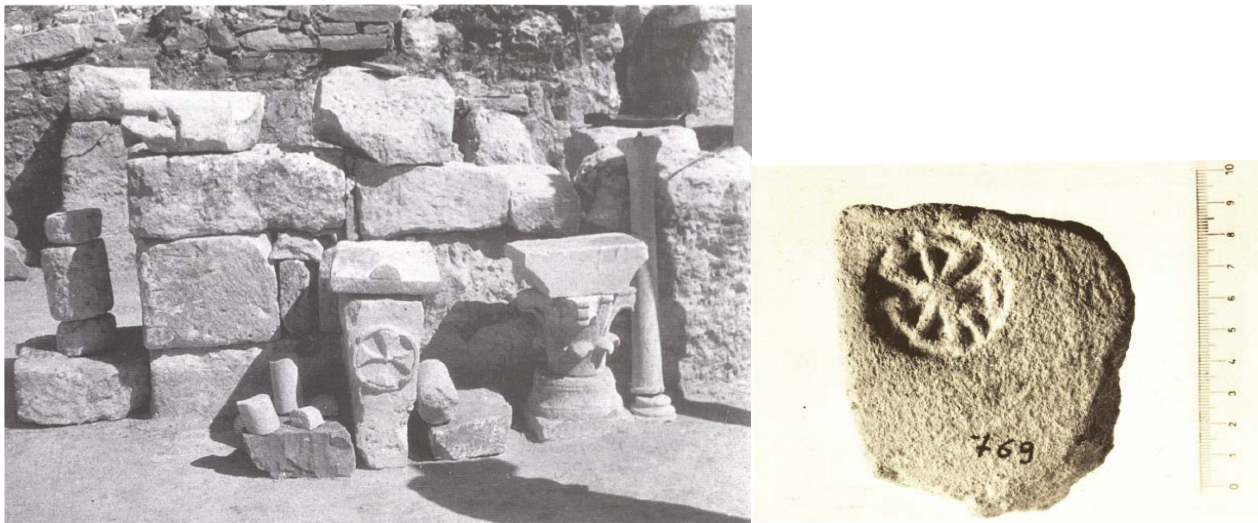
Fig. 6 - Área de las basílicas de Columbaris: ménsula con cruz entre los materiales escultóricos. (de SERRA 1995, pág. 411, fig. 4) y fragmento de teja con sello con cruz griega del pastoforio del baptisterio mayor (de DE MARIA 1986, lám. CXI, nº 7; lám. CXV, fig. 3).

Por último, del área de Columbaris también proviene un bloque de caliza (61x cm), que hoy en día ha desaparecido, con una cruz griega con brazos marcados en un círculo (fig. 6). La cruz se asemejaría al sello de una teja (fig. 6) hallada en el pastoforio de la derecha de la basílica bautismal. El análisis del tipo de cruz determina la cronología de la misma, es decir, que pertenece a la Antigüedad tardía.