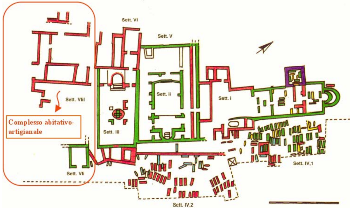
Fig. 7 - Área de las basílicas de Columbaris donde se indica el complejo residencial-artesanal (reelaboración gráfica por F. Collu, de Cornus I, 1, pág. 200, lám. II).

Museo arqueológico nacional G. A. Sanna de Sassari, y en parte, en el Antiquarium de Cuglieri.