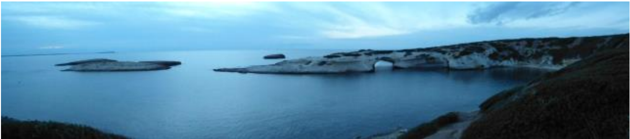
Fig. 2 - Vista de S'Archittu.

anclajes durante breves períodos, no se pueden identificar como un puerto romano bien estructurado.