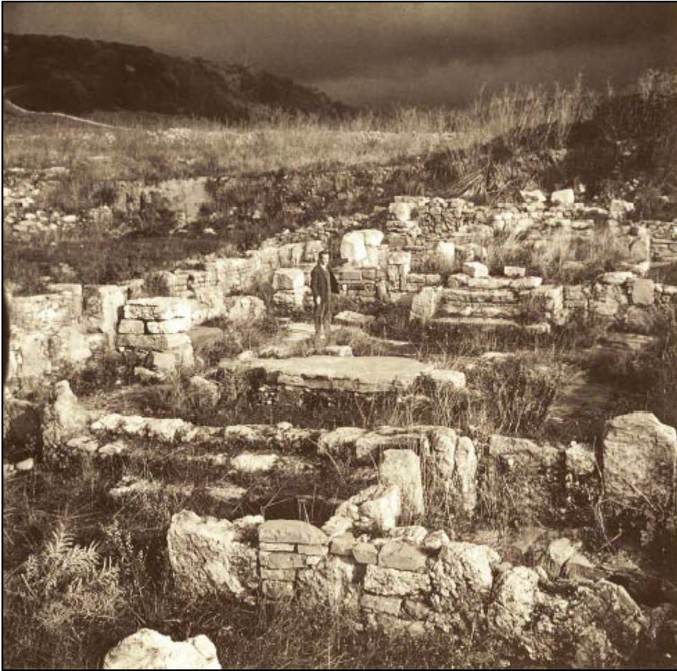
Fig. 2 - Basílica mayor: en el centro. la base del altar en basalto gris (de FARRIS 1993, pág. 86).