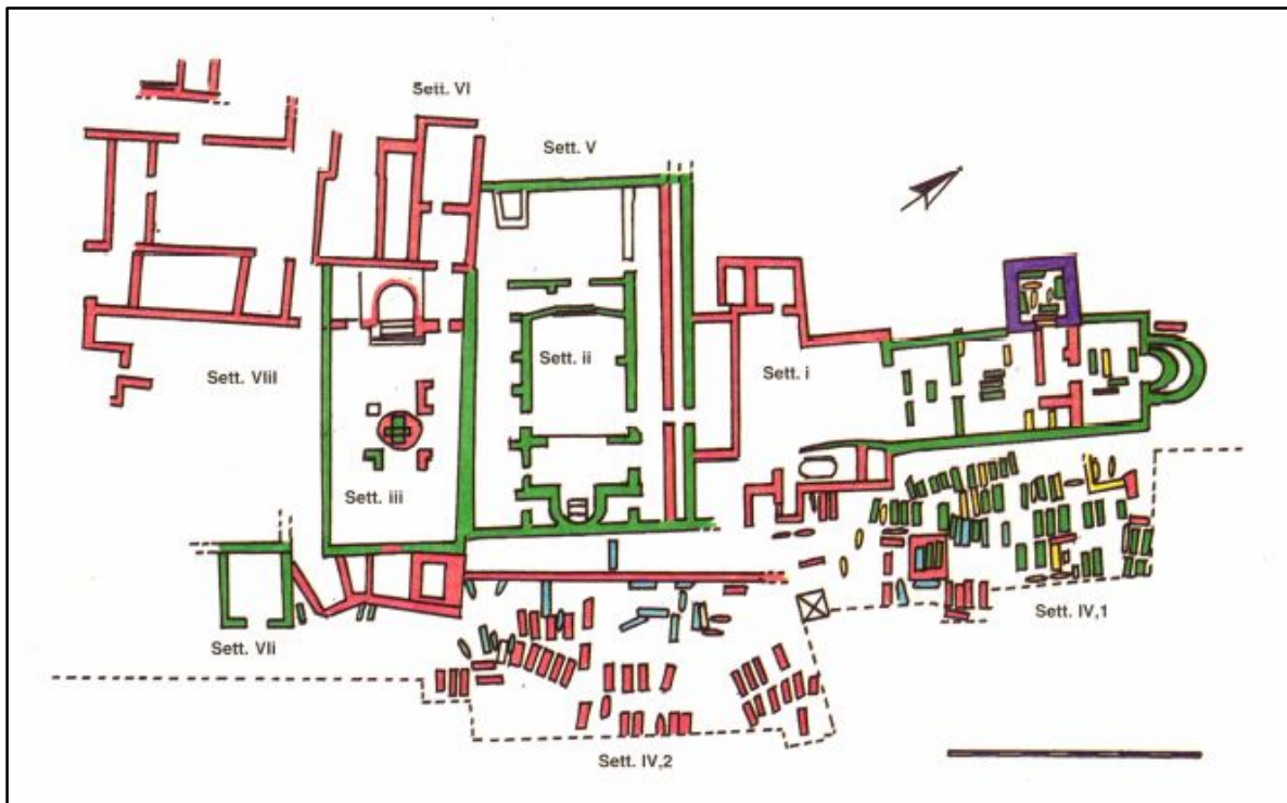
Fig. 4 - Planimetría del complejo de Columbaris-Cornus con la indicación de las fases y de los sectores (elaboración gráfica de L. SALADINO, M. C. SOMMA, de Cornus I.1, pág. 200, lám. II).

A los difuntos los apoyaban sobre un cojín fúnebre que creaban en el fondo del sarcófago, o realizado en material cerámico o lítico. En algunos casos, los ponían en dirección hacia la presencia de otros difuntos dentro de la misma colocación. A finales del siglo V, la falta de nuevos espacios para las sepulturas en el sector IV, 1, supuso la ampliación del área funeraria en el sector sur (llamado IV, 2) al este de la basílica episcopal y de la bautismal construidas al menos a partir del siglo V. El estrato de roca lo nivelaron y ahí colocaron los sarcófagos de caliza margosa, algunos de los cuales tenían un tamaño considerable. Durante el mismo período, colocaron una roca maciza en la parte superior del área, que permitía que las tumbas destacaran ligeramente con la cubierta o parte del borde. La colocación de las sepulturas en dicho sector se hizo por grupos o filas, muy probablemente con el fin de diferenciar a algunos núcleos familiares. Encontramos otras peculiaridades tanto en la presencia de osarios dentro de las tumbas, como en el caso del sarcófago 138, donde los huesos se hallaban a los pies del difunto, como en la presencia continua de material de cerámica y de vidrio que se ha encontrado en toda el área, en especial en relación con los elementos del refrigerium .