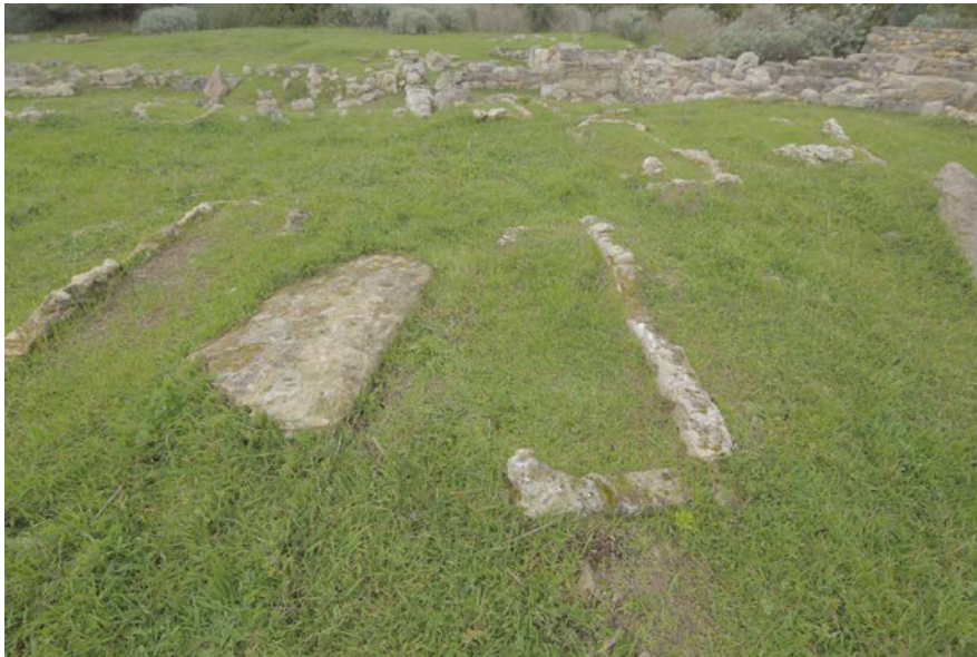
Fig. 5 - Cementerio en su estado actual.

En la segunda mitad del siglo VII dejaron de usar el área, probablemente debido a un gran incendio que afectó al área de las basílicas, que se derrumbaron sobre la necrópolis (fig. 5).