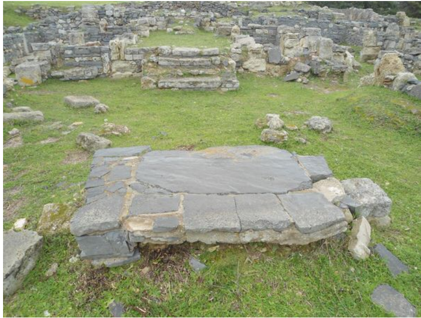
Fig. 8 - Altar de basalto con plintos laterales, vista desde el este.

La iglesia bautismal (fig. 9), que tenía el ábside en el oeste, contaba con 3 naves, una entrada en el lado oriental (a la que posteriormente añadieron paredes) y una pila bautismal.