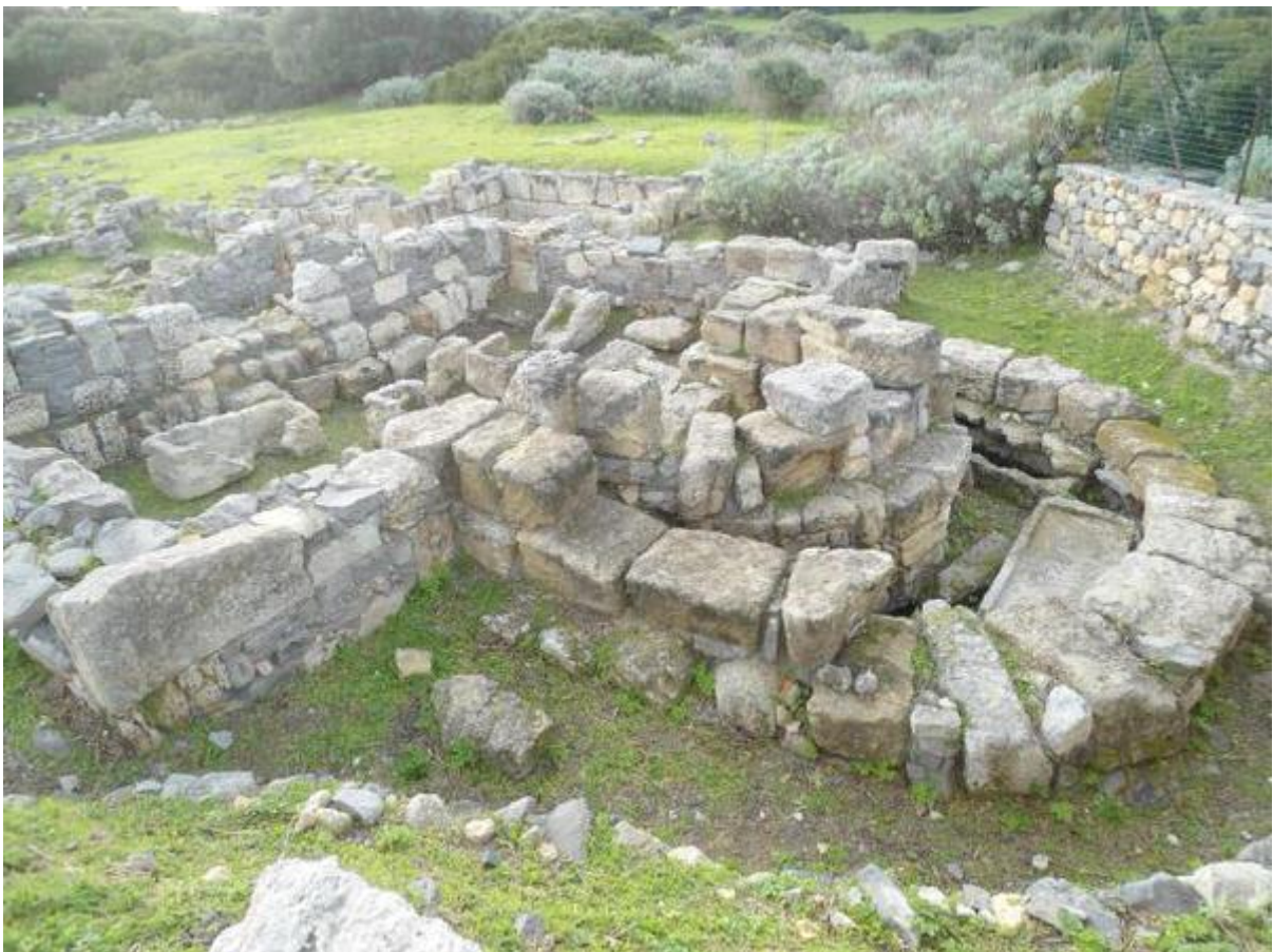
Fig. 4 - Basílica con cementerio, zona absidal, vista noreste del área.

dos ábsides concéntricos en el norte (resultado de un estrechamiento por problemas estáticos) y cinco ambientes contiguos. Entre finales del siglo V y principios del siglo VI d.C., la basílica sufrió algunas modificaciones en la organización de los espacios: crearon un pequeño pasillo transversal a través del que se accedía al mausoleo cuadrangular. Mientras en el lado sureste construyeron un espacio provisional con una bañera, ovalada en el exterior y rectangular en el interior, que se ha identificado como pila bautismal menor. En el lado norte de este último hay un recinto cerrado en todos sus lados y cubierto tras la introducción de un sarcófago. La basílica funeraria se comunicaba con el complejo episcopal que se desarrolló hacia el sur a través de un amplio patio. Muy probablemente crearon un recorrido con el fin de garantizar la conexión entre estas zonas y la necrópolis del lado este, en un punto comprometido durante las actividades de investigación de la década de 1960.