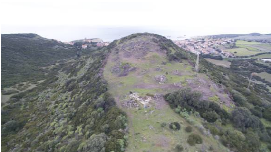
Fig. 1 - Colina de Corchinas.

La localidad fue fundada en la antigüedad: en las últimas décadas del siglo VI a.C., los cartagineses construyeron una ciudad ubicada probablemente en la meseta de Campu'e Corra, como pieza para conquistar la isla. Era una especie de avanzadilla militar para el control de Montiferru, a través de la que podían detener las incursiones de los autóctonos hacia las áreas más llanas del Campidano. Los restos más evidentes de dicho período histórico son las estructuras arquitectónicas y el material de los barrios residenciales del área circunstante la colina de Corchinas, en cuya altura debía de estar la acrópolis, protegida por una muralla. Una de las particularidades que pudo haber incidido en la elección del lugar para crear la ciudad quizás fue la cercanía con el mar y la posibilidad de tener una arribada segura, el Korakodes Portus , para el comercio. Probablemente, la ubicación estratégica junto con dicha característica dio a la ciudad una particular importancia. En un momento de incertidumbre como el creado por las Guerras púnicas, Cornus se convirtió en el estandarte de la revuelta antirromana en el año 215 a.C. dirigido por su comandante Hampsicora.