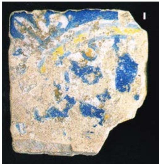
Fig. 3 - Fragmento de un azulejo de Vico III Lanusei (de Carta 2006, pág. 235, fig. 152).

El primero se puede comparar con otros dos hallazgos también en Cagliari, es decir, en Vico III Lanusei (fig. 3) 1 y en Via Cavour (fig. 4) 2 : dicho azulejo independiente 3 luce un medallón redondo y amarillo en el centro que refleja una estrella o una rosa de los vientos, con tonos blancos y azules con perlas doradas entre los pétalos; en sus cuatro esquinas se observa también el mismo número de motivos decorativos de ondas blancas con fondo azul. Según la pasta y el estilo, el ejemplar data de finales del siglo XVI - inicios del siglo XVIII y podría proceder de talleres catalanes.