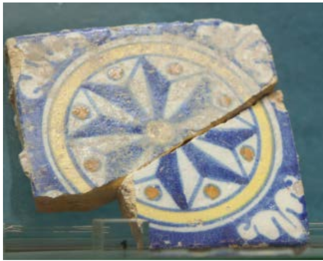
Fig. 1 - Azulejo con decoración tipo "rosa de los vientos" de S. Eulalia.

En el yacimiento de Sant'Eulalia se ha hallado una escasa cantidad de ejemplares de azulejos, denominados relojes, es decir, baldosas de terracota mayólica o simplemente barnizada, que usaban para los suelos o la decoración de las paredes: una de las muestras hallada contiene un motivo decorativo tipo "rosa de los vientos" (fig. 1) y otro luce elementos vegetales y rectilíneos (fig. 2) que ocupan toda la superficie