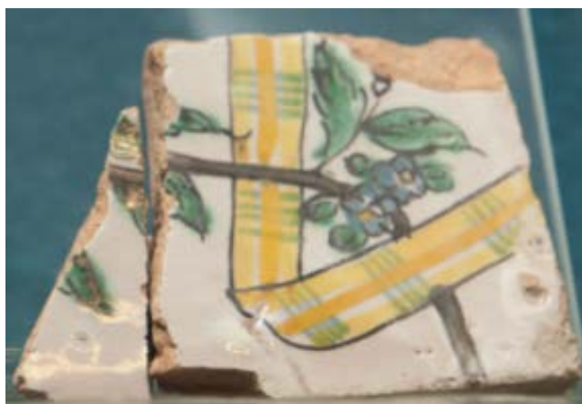
Fig. 2 - Azulejo con motivo vegetal.