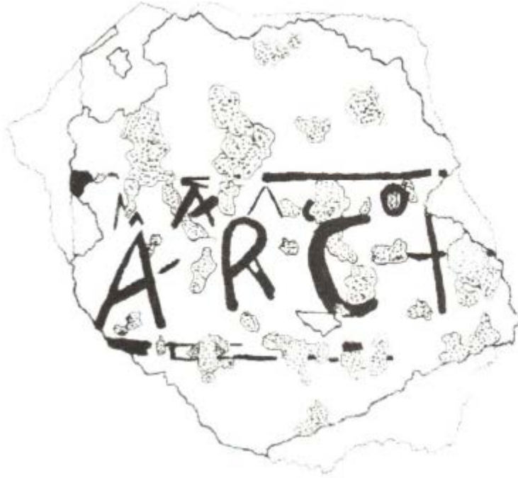
Fig. 2 - Reproducción gráfica del fragmento de enlucido pintado (de Mura 2008, pág. 280, fig. 2).

El texto epigráfico se puede interpretar de varias formas: podría ser el nombre de una persona ( Archelaus ), una profesión ( architectus ) o incluso un lugar ( archivum ). Otra de las hipótesis que se ha barajado es el término archiepiscopus 1 , que haría referencia a la sede de la diócesis de Karales que, como han demostrado las fuentes escritas, ya tenía un primer representante en el Consejo de Arles del año 314 y fue otorgada el nivel de metropolitana en 484, en la época del Consejo de Cartago 2 . Dicha teoría podría estar demostrada por la cercanía de la pila bautismal de la iglesia del Santo Sepulcro de la misma ciudad, en dirección hacia una imaginaria prolongación del pórtico más allá del área excavada. Esto podría suponer la presencia de la primitiva cátedra episcopalis calaritana que nunca ha sido hallada 3 . Este descubrimiento representa un raro caso de inscripción pintada en Cerdeña dado que sólo se han conocido cinco casos que hacían