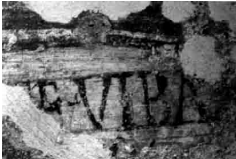
Fig. 4 - Sant'Antioco: detalle de la inscripción pintada E VIBA en el arcosolio C/VII (de Nieddu 2011, pág. 82, fig. 5).