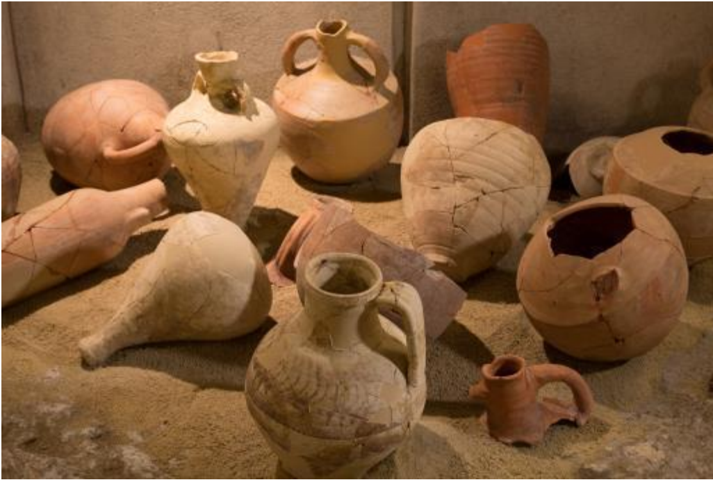
Fig. 2 - Ánforas y jarras restauradas: en primer plano se observa una jarra en cerámica flameada