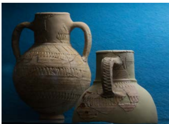
Fig. 4 - Ánfora de dos asas y jarra con una sola asa con motivo en zigzag.

extracción del agua de parte los habitantes del barrio 3 . Se han encontrado ánforas con una o dos asas con secciones acanaladas, con grabados en zigzag (fig. 4); en algunos casos en todo el cuerpo, en otros en el hombro, y tipo «peine», diagonales u horizontales, que formaban un motivo geométrico (fig. 2); también había pequeñas ánforas acanaladas de la era bizantina, ánforas de producción africana, un ánfora de bronce (fig. 5) y jarras de cerámica flameada 4 (figs. 1-2).