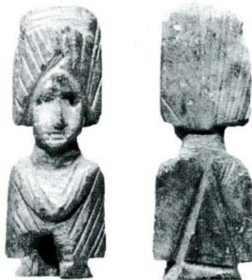
Fig. 3 - Cabeza de la aguja con busto femenino, de Biassono (de Bianchi 1996, pág. 1, fig. 1).

femenino podrían hacer referencia al tipo «A XXI, 8» de la clasificación creada por Beal, muy común incluso en la época de Claudio-Nerón y hasta el siglo III-IV d.C. 3 . El objeto encuentra unos rasgos muy similares con el ejemplar de la Lombardía hallado en la aldea romana de Biassono, Lombardía 4 (fig. 3).