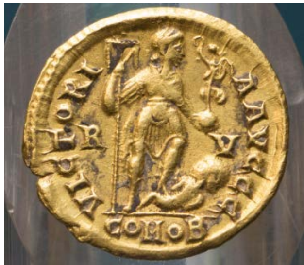
Figs. 1, 2 - Moneda de oro de Honorio: anverso (1) y reverso (2), (foto de Unicity S.p.A.).