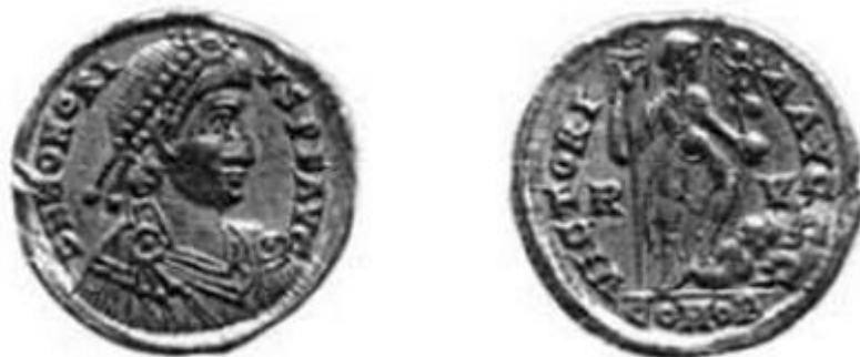
Fig. 3 - Moneda de oro macizo de Honorio I acuñada por la ceca de Rávena (de RIC X, lám. 40, nº 1321).

Es de particular interés la figura del busto de Honorio con el típico peinado con una doble hilera de cuentas y la típica vestimenta (quizás un paludamentum ) sujeta con un broche redondo con cuatro colgantes (fig. 1). La iconografía del imperator se puede comparar con la de una moneda de bronce hallada en el yacimiento arqueológico de Cornus, en el área del cementerio de Columbaris (fig. 4) 1 .