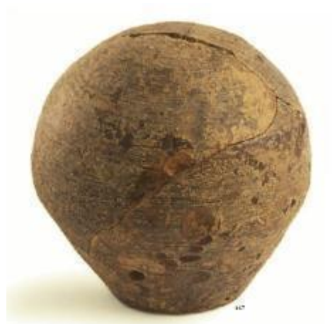
Fig. 4 - Hucha de un silo del Duomo de Sassari, siglo XIV. (de Martorelli 2007, fig. 147, pág. 85).