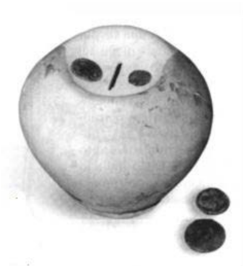
Fig. 3 - Ejemplar de la época imperial del Museo arqueológico de (Ptoj-Slovenia ( http://badwila.net/pottery/salvadanai/index.html )).

Todavía es incierta la ocasión en la que usaron dichos objetos, aunque, naturalmente, su función era la de contener monedas, pero cuyo espacio limitado no permitía albergar auténticos tesoros 4 . De forma contraria a su función, la mayoría de los ejemplares íntegros o que se han podido reconstruir completamente (figs. 3 y 4) se ha hallado sin su contenido. Los contextos de proveniencia de los mismos no permiten realizar una generalización para hipotetizar su uso en ciertas clases sociales, tanto en circunstancias privadas como públicas, e incluso en relación con la vida cotidiana o en el ámbito sepulcral.