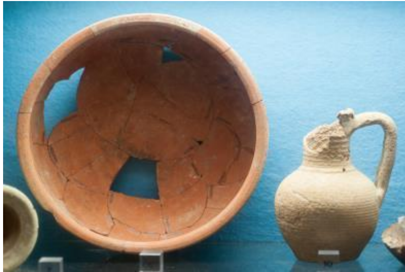
Fig. 4 - - Detalle de la exposición: marmita y jarra bizantina con un asa.