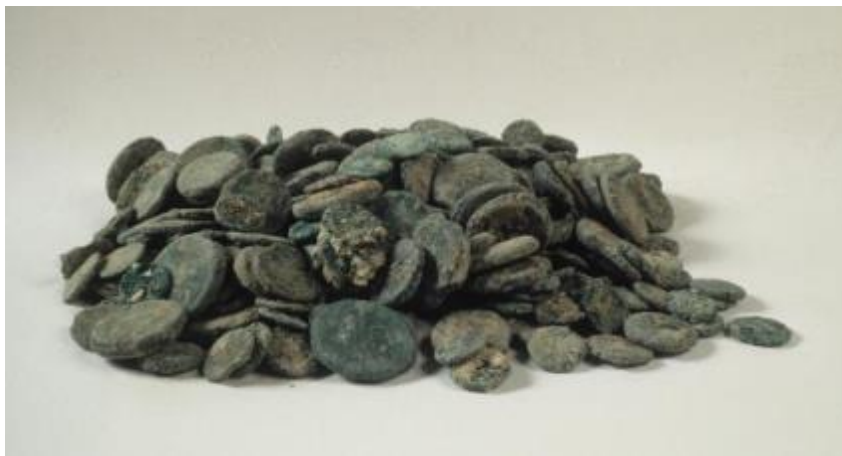
Fig. 2 - Monedas del thesaurus.

Los objetos de bronce demuestran el uso continuo de un santuario durante varios siglos, al que perteneció el thesaurus . Un estudio preliminar realizado a las primeras monedas