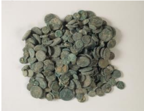
Fig. 1 - Las 307 monedas hallada en el thesaurus.

En el interior del pozo del thesaurus hallado en el área noroeste de Sant'Eulalia se han hallado 307 monedas de bronce (figs. 1 y 2) que datan de entre el siglo III a.C. y finales del siglo I a.C., es decir, de la era púnica tardía hasta inicios del principado de Augusto 1 .