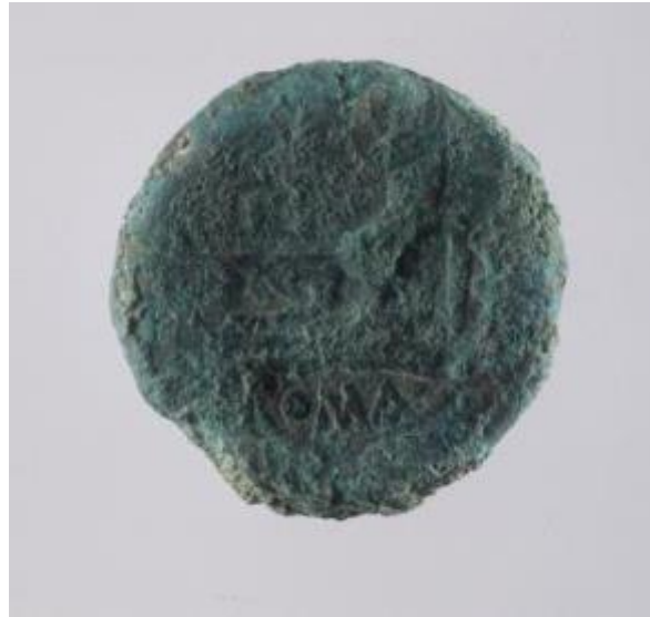
Fig. 3 - Moneda hallada en el thesaurus : reverso.

restauradas ha identificado algunos semiejes que datan de entre el siglo III y el siglo II a.C. 2 ; mientras que hay otras monedas que fueron testigos del predominio romano en el año 238 a.C., en cuyo exergo muestran el término ROMA, que se ha hipotetizado que fue la ceca de producción (figs. 3 y 4).