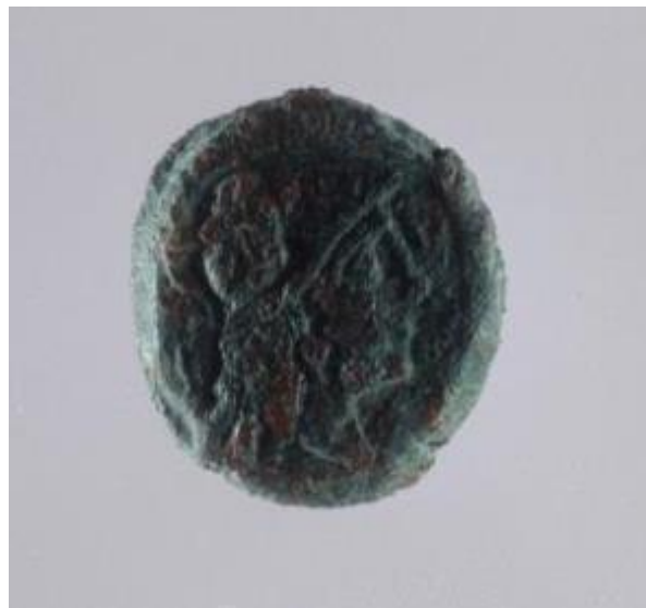
Fig. 4 - Moneda hallada en el thesaurus : anverso