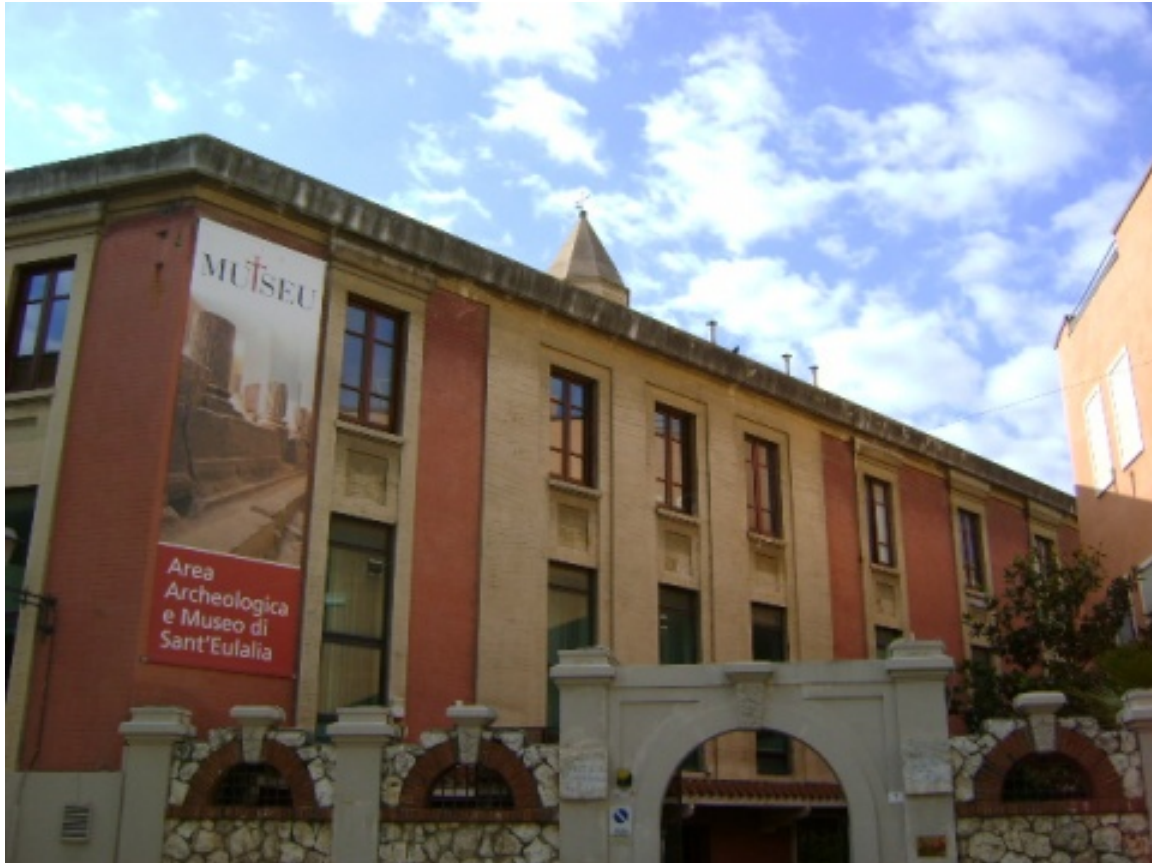
Fig. 1 - Entrada a la zona de museos de Santa Eulalia-MUTSEU.

■ Complejo de museos de Santa Eulalia - Mutseu El MUTSEU (fig. 1), el complejo de museos de Santa Eulalia, se encuentra en el callejón del Collegio 2, en un edificio al lado de la homónima iglesia, en el barrio histórico de Marina en Cagliari. Incluye un enclave arqueológico, la exposición de los restos del mismo lugar y el museo del Tesoro (fig. 2).