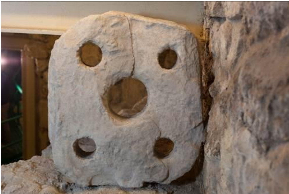
Fig. 1 - Cagliari, Santa Eulalia: piedra perforada.

Uno de los hallazgos más particulares ha sido un elemento de caliza de forma cuadrada con un orificio en cada esquina y uno en la parte central (fig. 1) 1 .