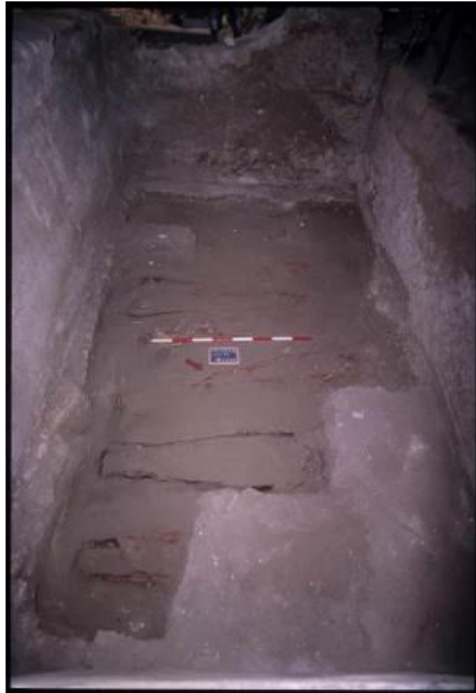
Fig. 3 - Planta de las sepulturas de la cripta (de Martorelli, Mureddu 2002a, pág. 50, fig. 27).

Los tipos de sepulcros que usaban preveían fosas al nivel del suelo en la fase inicial de uso de la cripta 4 , y posteriormente la colocación en cajas de madera de forma trapezoidal (fig. 4). Quizás, los cuerpos de los difuntos estaban colocados sobre las tapas de los féretros anteriores, envueltos en un sudario y con una capa de cal. En otros casos, los difuntos ocupaban el espacio libre entre dos ataúdes para aprovechar al máximo el espacio restante 5 .