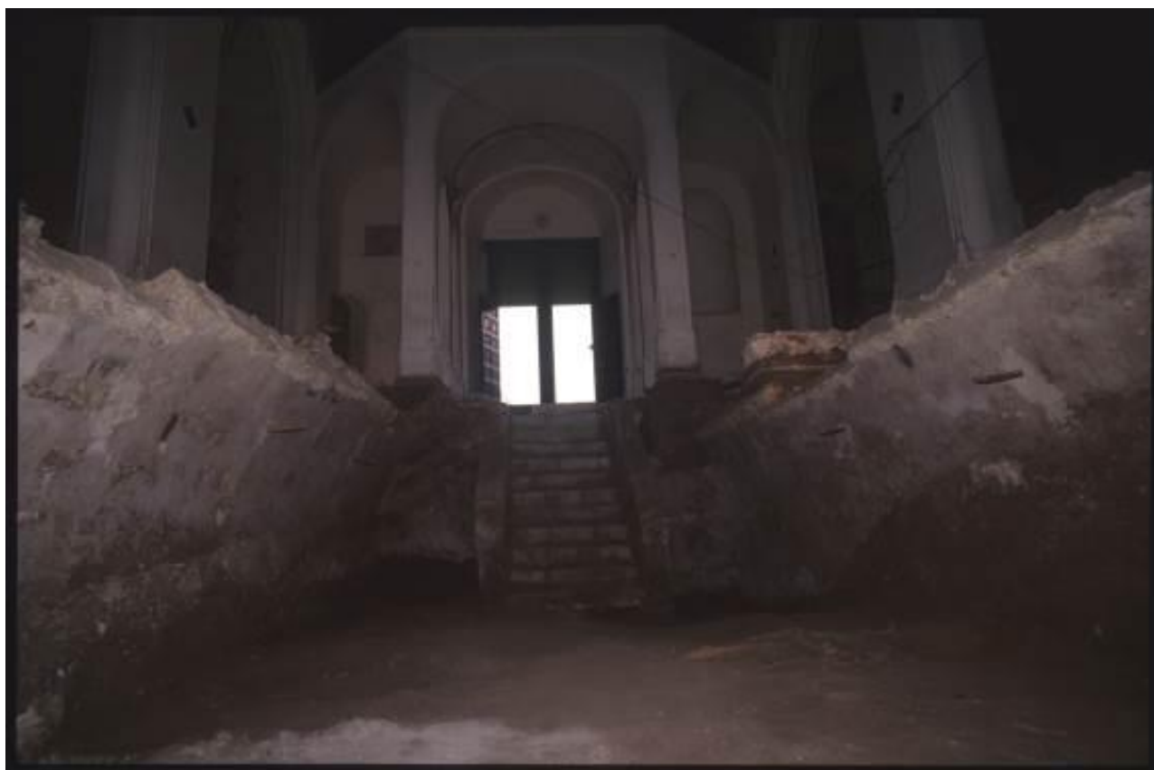
Fig. 1 - Cripta central en el momento de la excavación realizada dentro de la iglesia. El techo de la cripta contiene una bóveda.

Por debajo de la nave central de la iglesia de Sant'Eulalia (figs. 1-2), entre el siglo XVII y el inicio del siglo XVIII 1 , crearon la cripta mayor de las siete que se han encontrado 2 .