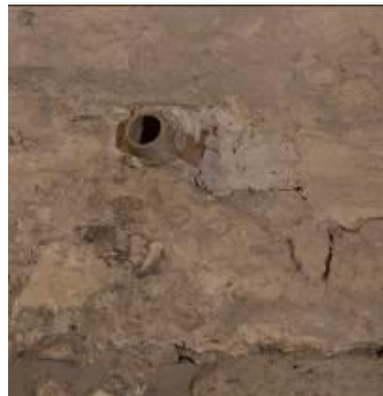
Fig. 3 - Tubo figulino.