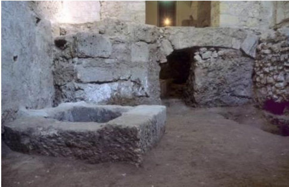
Fig. 1 - Arquivolta del siglo XVII (foto de AFS).