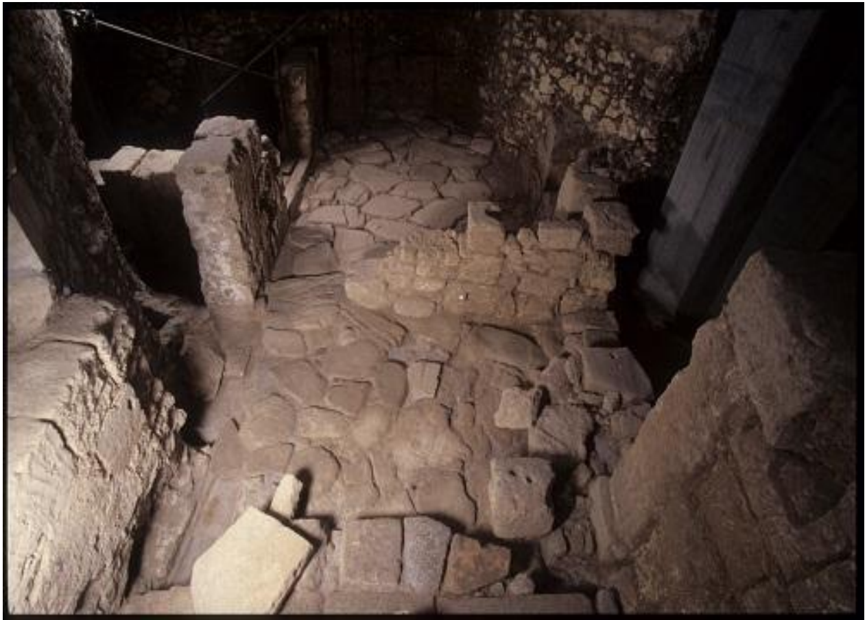
Fig. 2 - Calle empedrada y algunas partes de los muros que revelaron diferentes fases de construcción (foto de AFS).

construcción, un monumental pórtico con columnas y una profunda cisterna con forma de botella.