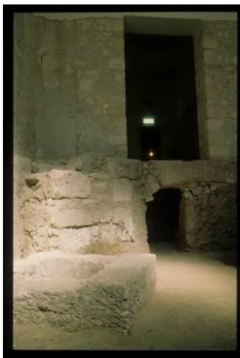
Fig. 1 - El primer hallazgo: la arquivolta del pozo y los tabiques de los muros más allá de la sacristía.