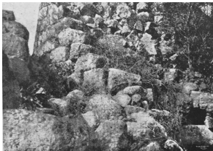
Fig. 1 - Nuraga Puttu de Inza (de Taramelli 1919, fig. 31, págs. 77 - 78).

Entre los materiales recuperados durante la eliminación de los restos del derrumbe del nuraga complejo Puttu de Inza (fig. 1), ubicado en la llanura de Santa Lucia, se encuentra una pequeña hacha metamórfica de color verde, de forma rectangular, con lama recta y de un tamaño de 9 cm (fig. 2).