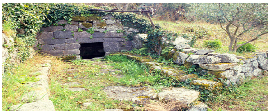
Fig. 1 - Fuente nurágica de Su Lumarzu (de http://www.sardegnaicultura.it/immagini/7_88_20070118152906.jpg ).

En Fontana Lumarzu, en Rebeccu de Bonorva (fig. 1), descubierta a principios del siglo XX y datada entre la Edad del Bronce final y la Primera Edad del Hierro, se ha hallado un particular vaso en miniatura con carácter votivo y cuatro asas (fig. 2).