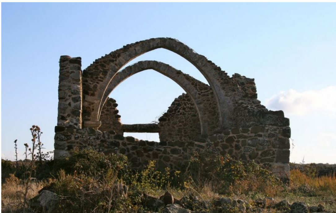
Fig. 4 - Los restos de la iglesia de S. Simeone, Bonorva.

Además, en las inmediaciones de las muras también se observan los restos de la aldea medieval de Sanctus Simeon y de la homónima iglesia ubicada en un terreno de propiedad privada en la meseta que lleva hasta «Su Monte» y a la llanura de Campeda. Hoy en día, el edificio, de una sola nave, se encuentra en un estado de degradación (fig. 4).