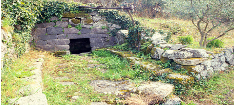
Fig. 4 - Fuente nurágica de Su Lumarzu (de http://www.sardegnaicultura.it/immagini/7_88_20070118152906.jpg ).