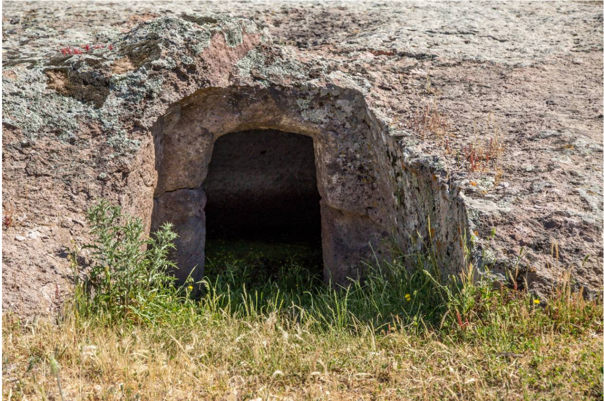
Fig. 2 - Entrada al hipogeo XII (foto de Unicity S.p.A.).