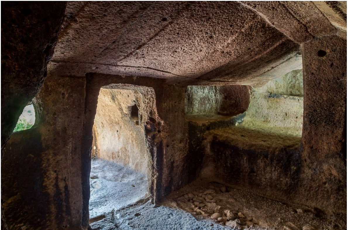
Figs. 2, 3 - Detalle del techo que caracteriza la domus de janas VIII de S. Andrea Priu, conocida como «Tumba de cámara».