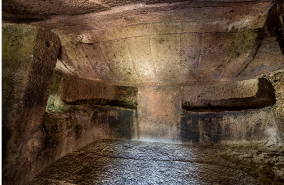
Fig. 4 - Los dos nichos decorativos.

El techo está sostenido por dos pilares, uno de los cuales (el de la izquierda) se apoya sobre un banco funerario del lado izquierdo, creando de esta forma dos nichos decorativos (figs. 4 y 5).