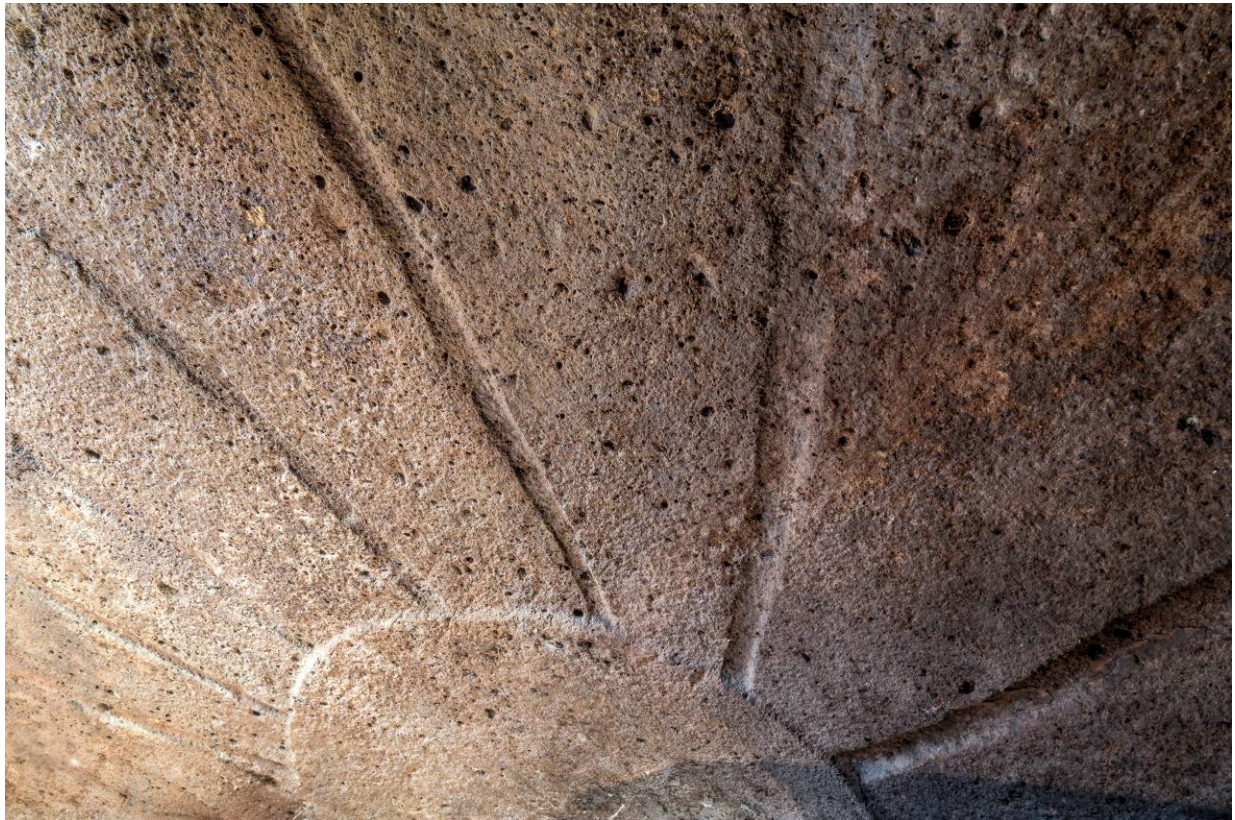
Fig. 2 - El techo de la anticámara.

El tejado, inclinado hacia la entrada, imita las vigas de madera que sostenían el techo de la cabaña prehistórica (fig. 2).