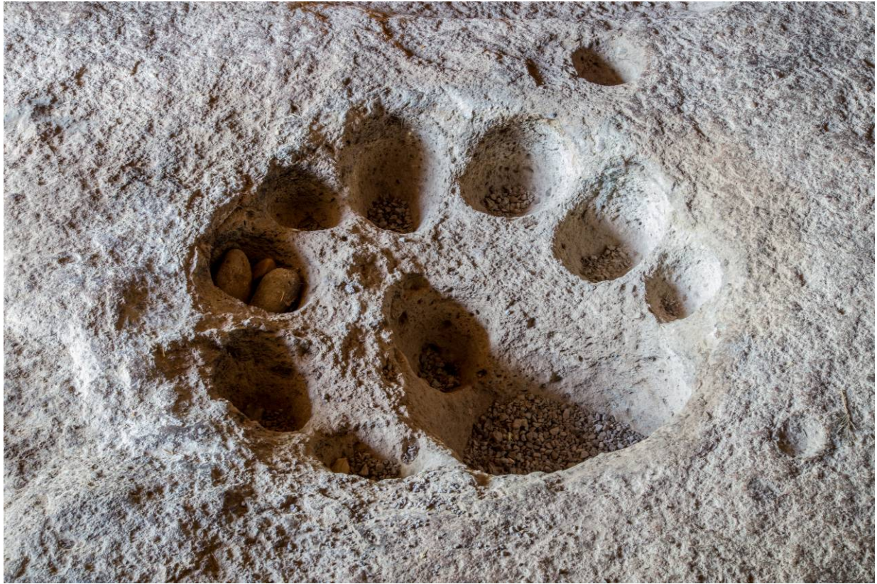
Fig. 4 - Las hendiduras presentes en el suelo de la anticámara (foto de Unicity S.p.A.).

Las dos cámaras principales, alineadas una al lado de la otra en sentido longitudinal son rectangulares y están caracterizadas por un tejado plano sostenido por dos columnas ahusadas hacia la parte superior. Alrededor de las mismas están las cámaras más pequeñas, con paredes rectas y curvas.