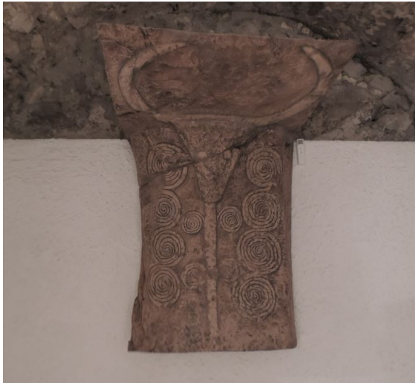
Fig. 7 - Calco del prótomo taurino de la «Tumba de espiral», necrópolis «Tenuta Mariani».

y motivos en espiral, presenta en la «Tumba de espirales» ( domus de janas nº 3) de la necrópolis de domus de janas en la denominada Tenuta Mariani de Bonorva (fig. 7).