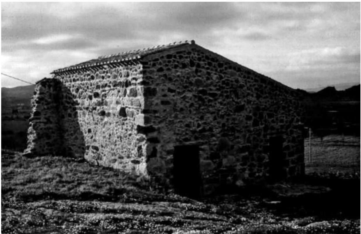
Fig. 2 - El edificio de Sas Presones de Rebeccu tras su restauración (de Mastino, Ruggeri 2009, pág. 556, fig. 2).

Los recientes trabajos de restauración de Sas Presones han permitido estudiar con atención los dos ambientes que han sobrevivido y la planta en general del edificio original, que debió incluir al menos 8 ambientes (fig. 2).