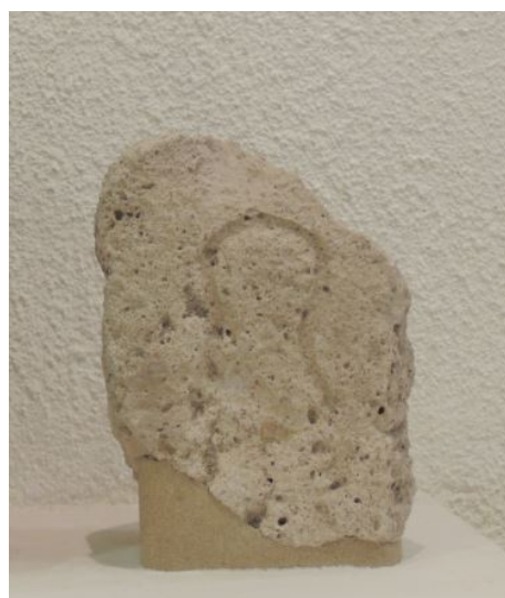
Fig. 5 - Estela de la necrópolis de Su Terranzu. Museo arqueológico de Bonorva.