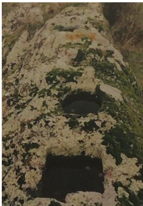
Fig. 3 - Necrópolis de Su Terranzu.