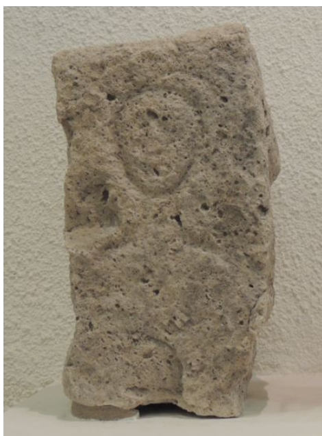
Fig. 4 - Estela de la necrópolis de Su Terranzu. Museo arqueológico de Bonorva.

Además, era bastante común marcar las tumbas con estelas con figuras funerarias grabadas. Estas las colocaban verticalmente encima de la sepultura. En Su Terranzuse han hallado dos de la Era púnico-romana. En la primera reprodujeron una figura humana fuertemente influenciada por una tradición iconográfica púnica del ámbito rural (fig. 4); la segunda se conserva parcialmente y presenta una figura similar (fig. 5).