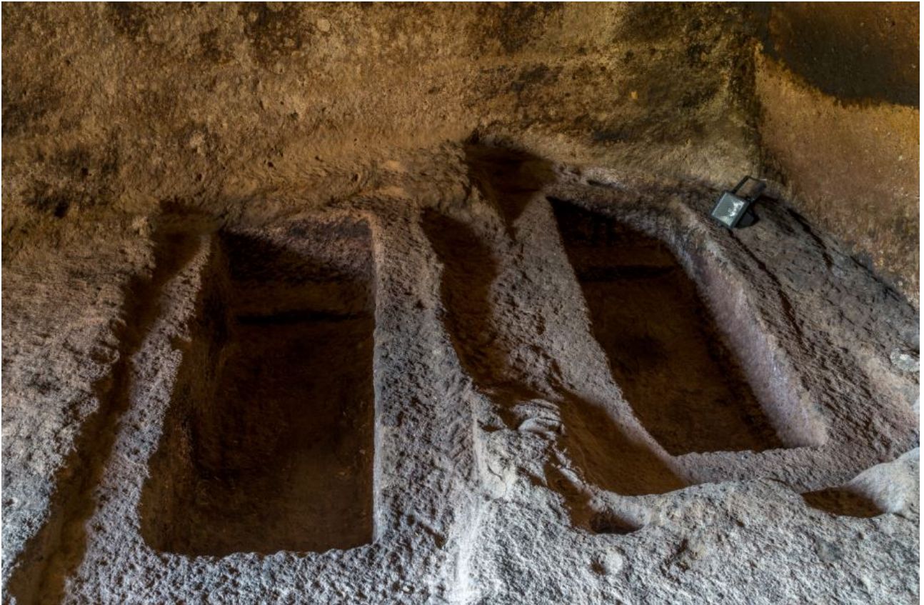
Fig. 2 - Tumbas bizantinas excavadas en el suelo del nártex interior de la iglesia rupestre

Enfrente de la entrada de la iglesia rupestre hay un gran bloque de traquita, con una longitud de 8 metros y una anchura de 3 metros, en cuya parte superior hay excavada una tumba; mientras que en la parte sureste hay unas escaleras en la roca (figs. 3 y 4). Esta sepultura, con un pulvino, tiene orientación noroeste y sureste, con una longitud de 188 cm (es decir, 6 pies bizantinos), una anchura de 55 cm y una profundidad de 35 cm en correspondencia con el pulvino y 70 cm hacia el lado opuesto. Alrededor de la tumba hay una abertura con una anchura de 10 cm, que servía para apoyar la losa de la cubierta. Data de la Edad Media Alta, al igual que las otras dos sepulturas excavadas en el suelo del endonártex, a las que se asemeja por tipo y diseño.