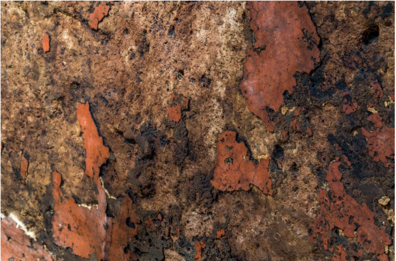
Fig. 6 - Restos de ocre rojo en el tejado del endonártex.