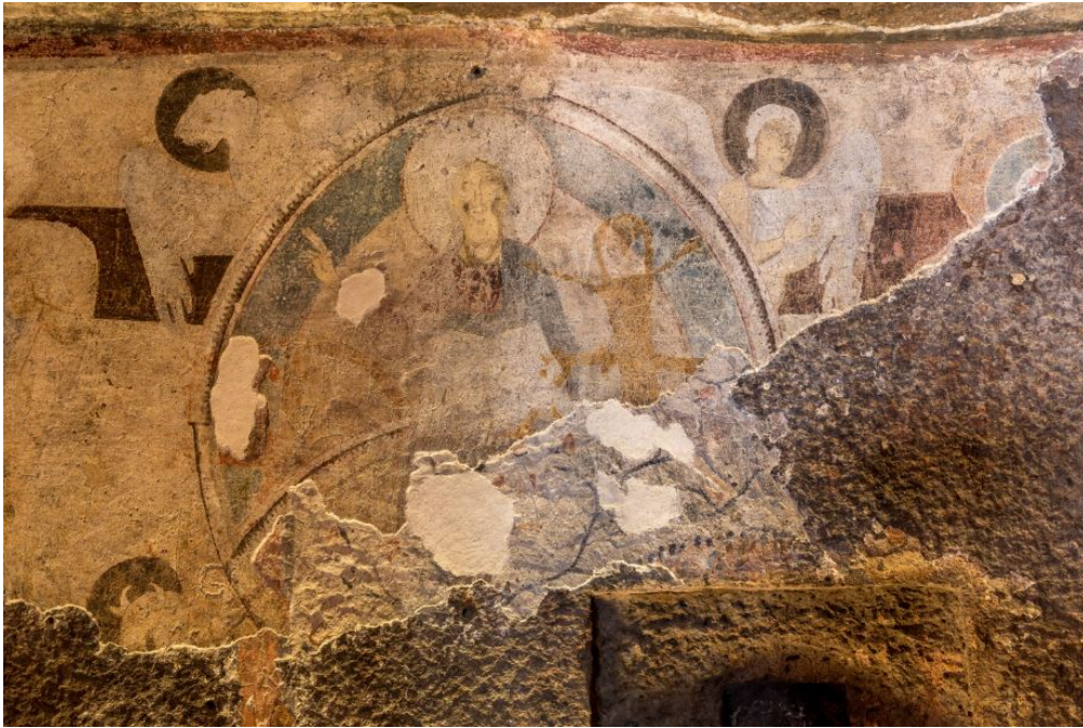
Fig. 4 - El Cristo benediciente.

Las figuras de los cinco santos, que han sido identificados como apóstoles por sus nombres, ocupan las paredes del lado derecho, seguidas por San Juan Bautista, la Virgen y otros cinco apóstoles o santos (figs. 5 y 6).