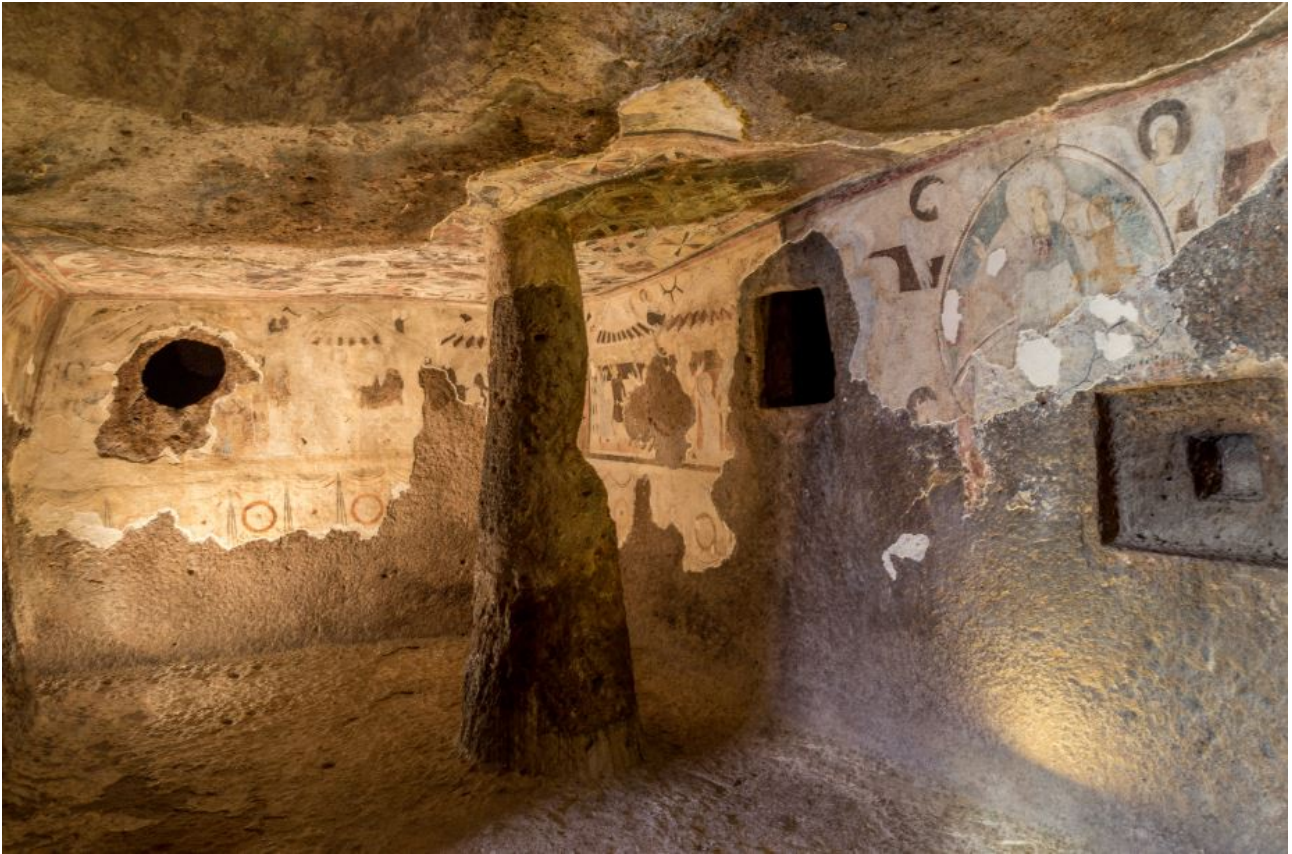
Fig. 2 - Frescos con escenas de la vida de Jesús (foto de Unicity S.p.A.).