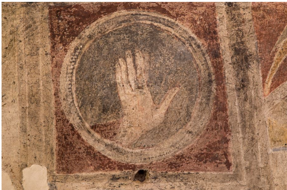
Fig. 3 - La mano de Dios.

En el centro, en eje con la entrada, se encuentra la figura de Cristo bendiciendo (fig. 4).