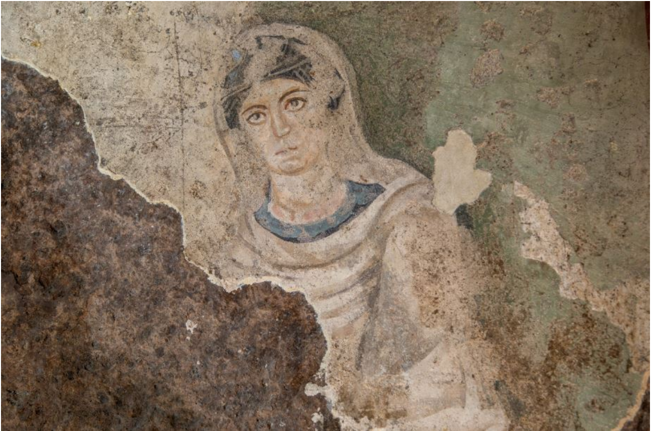
Fig. 4 - Figura femenina en la pared del aula.