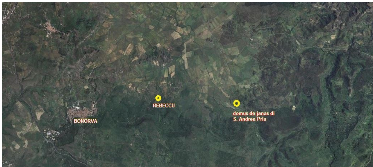
Fig. 1 - Bonorva, Rebeccu y el lugar de la necrópolis de S. Andrea Priu (de Sardegnaoportale; reelaborado por M.G. Arru).

Son sepulturas hipogéicas características de la Cerdeña prenurágica, que datan de mediados del milenio IV a.C. y que formaron parte del período de la Cultura de Ozieri (Neolítico reciente 3200-2850 a.C.). Se trata de una evolución y enriquecimiento de un tipo tumbal que ya era conocido y muy específico de la cultura de Bonuighinu.