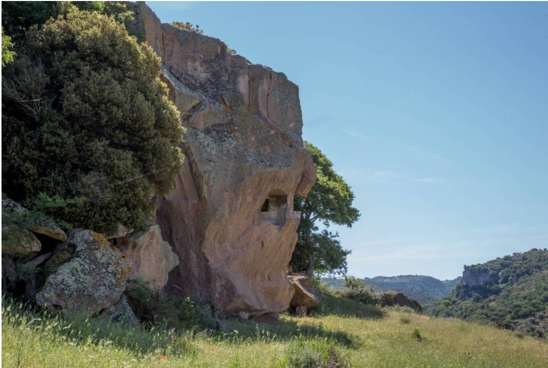
Fig. 16 - El hipogeo X parcialmente destruido por las explosiones de 1967.

En la cima de la llanura todavía se observan algunas domus más sencillas (figs. 17 y 18), además de la roca conocida como el «Toro» o el «Campanario» (fig. 19), que se presenta como una tabla horizontal sujetado por cuatro pilares. Probablemente, en su origen fue una tumba con una única cámara realizada excavando un macizo que salía de la superficie rocosa, cuyas paredes eliminaron posteriormente.