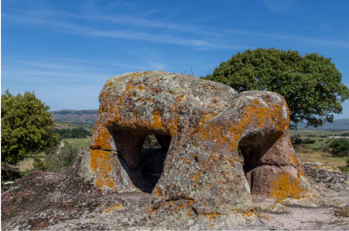
Fig. 19 - El «Toro» o «Campanario».

Durante años, la zona, muy rica en restos arqueológicos, ha sido el objetivo de expertos, ladrones de sepulturas y pastores que han usado las tumbas hipogéicas, que habían sido saqueadas desde hacía mucho tiempo, y las han transformado en cuevas para acoger al ganado o guardar el heno.