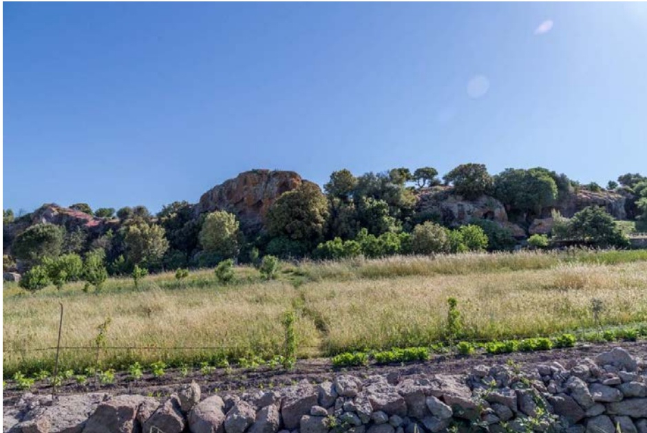
Fig. 2 - La pared de traquita en la que se encuentran excavadas las domus de la necrópolis de S. Andrea Priu.

Las cuevas artificiales de carácter funerario colectivo, sencillas o complejas, están excavadas en la pared vertical de una roca de traquita roja con una altura aprox. De 10 metros y con orientación sur (figs. 2 y 3).