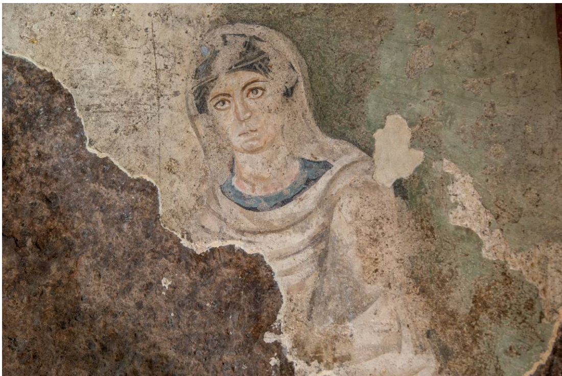
Figs. 11, 12 - Frescos cristianos presentes en la pared del aula de la domus de janas VI de S. Andrea Priu.