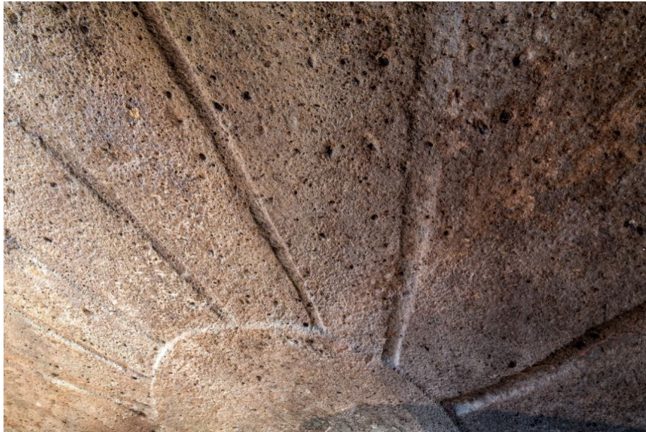
Fig. 8 - El techo del endonártex.

En la pared del fondo se abre la puerta (fig. 9) que permite acceder a los otros dos ambientes mayores (fig. 10), de planta rectangular y techo plano sujetado por columnas en la roca, cuyas paredes cuentan con aberturas de entrada hacia las numerosas celdas secundarias, caracterizadas por la presencia de nichos y bancos.