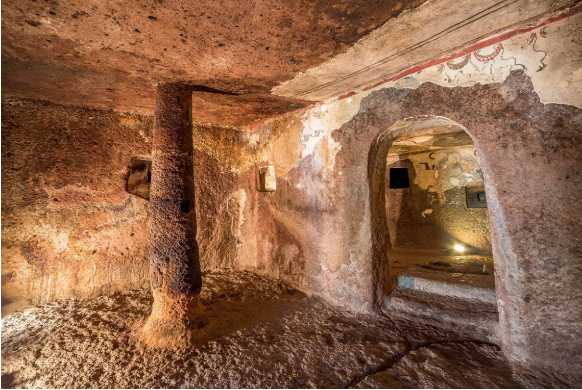
Fig. 10 - Aula de la domus de janas VI de S. Andrea Priu.

En el techo del último espacio mayor se abre un pozo de luz que llega hasta el piso superior.