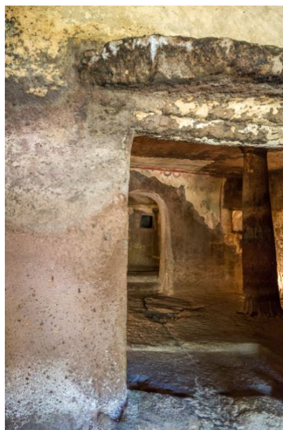
Fig. 9 - La puerta a través de la cual se accede del endonártex al aula (foto de Unicity S.p.A.).

En la pared del fondo se abre la puerta (fig. 9) que permite acceder a los otros dos ambientes mayores (fig. 10), de planta rectangular y techo plano sujetado por columnas en la roca, cuyas paredes cuentan con aberturas de entrada hacia las numerosas celdas secundarias, caracterizadas por la presencia de nichos y bancos.