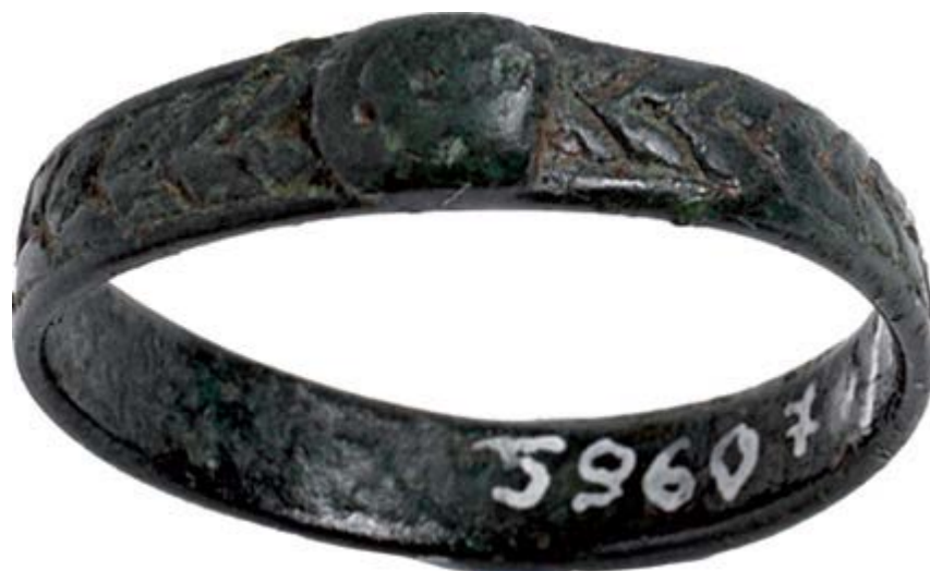
Fig. 4 - Anillo de bronce (de MERELLA 2014, pág. 284)

En Cerdeña, en el ámbito de la producción de adornos nurágicos, cabe destacar el anillo de franja hallado en la aldea nurágica de Costa Nighedda de Oliena (fig. 4), del siglo XII-X a.C.