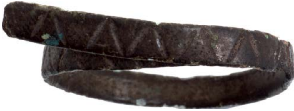
Fig. 2 - Anillo de bronce (de MERELLA 2014, pág. 283).

En la actualidad es único en su género y no tiene comparación con ningún otro objeto. El ámbito cronológico al que pertenece es entre los siglos IX-VIII a.C., es decir, a principios de la Edad del Hierro.