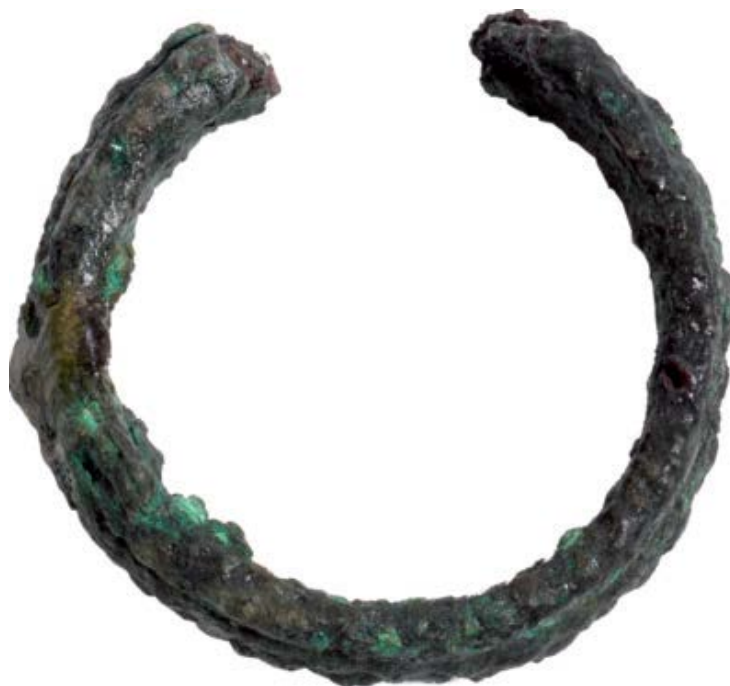
Fig. 3 - Anillo de bronce (de MERELLA 2014, pág. 283)

En el territorio de Arzachena, a pesar de ser de un tipo y de una cronología diferentes, se ha hallado un anillo con una franja trenzada (fig. 3) en la cámara n del nuraga Albucciu, y que data del arco cronológico de entre los siglos XVI y VIII a.C.