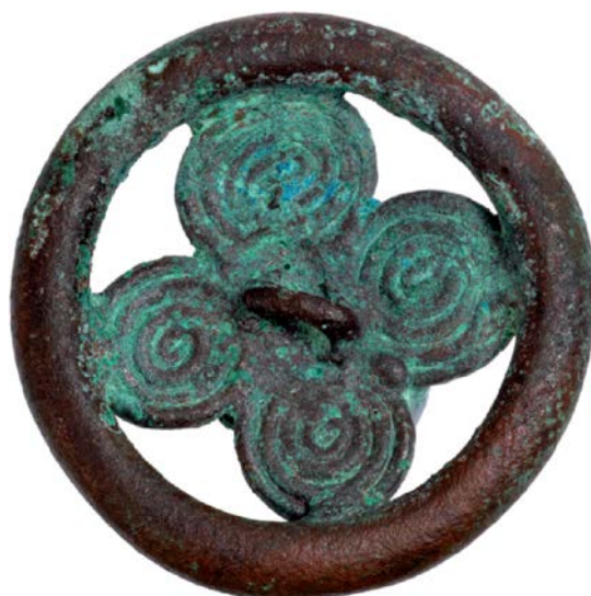
Fig. 3 - Colgante del nuraga Nurdole de Orani (de Moravetti, Alba, Foddai 2014, pág. 280).