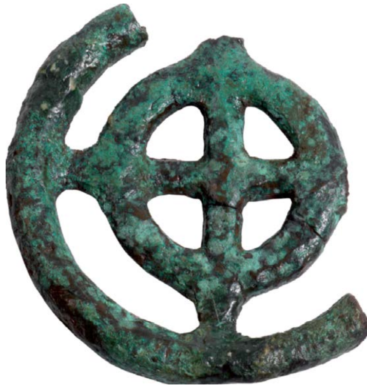
Fig. 2 - Colgante con forma de rueda con cuatro rayos (de Moravetti, Alba, Foddai 2014, pág. 209).

El colgante podría estar estrechamente relacionado con el símbolo del disco solar, unión de las fuerzas del cielo, presente también en otros restos hallados en diferentes contextos de Cerdeña: por ejemplo, el motivo se repite en un colgante que se encontró en el nuraga Nurdole de Orani, mientras que en el nuraga Genna Maria de Villanovaforru se descubrió una pintadera con forma de disco decorada con cinco círculos concéntricos colocados en cruz, al que se le denomina unicum (figs. 3 y 4).