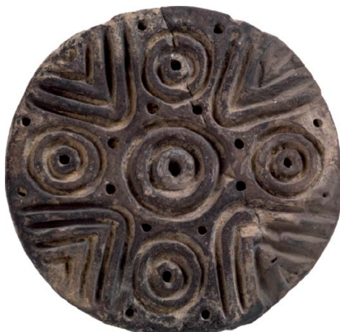
Fig. 4 - Pintadera del nuraga Genna Maria de Villanovaforru (de Moravetti, Alba, Foddai 2014, pág. 257).

La arqueóloga Giuseppa Tanda estudió e interpretó el objeto en la década de 1980, además de volver a formular su época de origen. Esta experta identificó en el objeto la cabeza de una aguja decorativa, que quizás usaban para abrochar una túnica u otro tipo de prenda. Esta hipótesis está respaldada por la presencia de una fina marca de ruptura de una parte que falta, justo en la parte central del disco. La nueva fecha