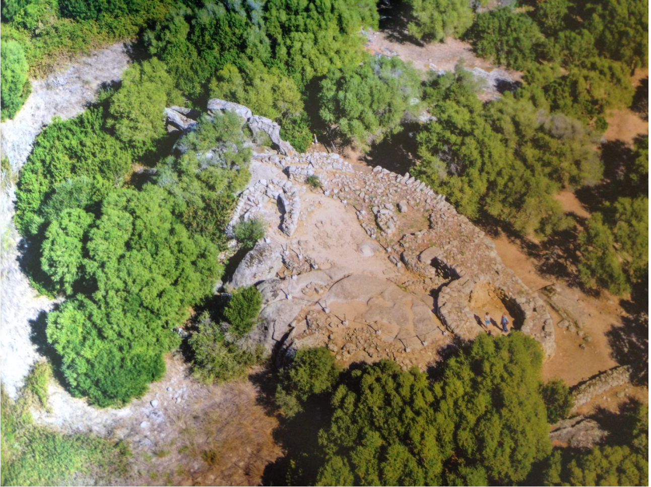
Fig. 2 - Vista desde el alto del nuraga Albucciu (de ANTONA 2013, pág. 97).