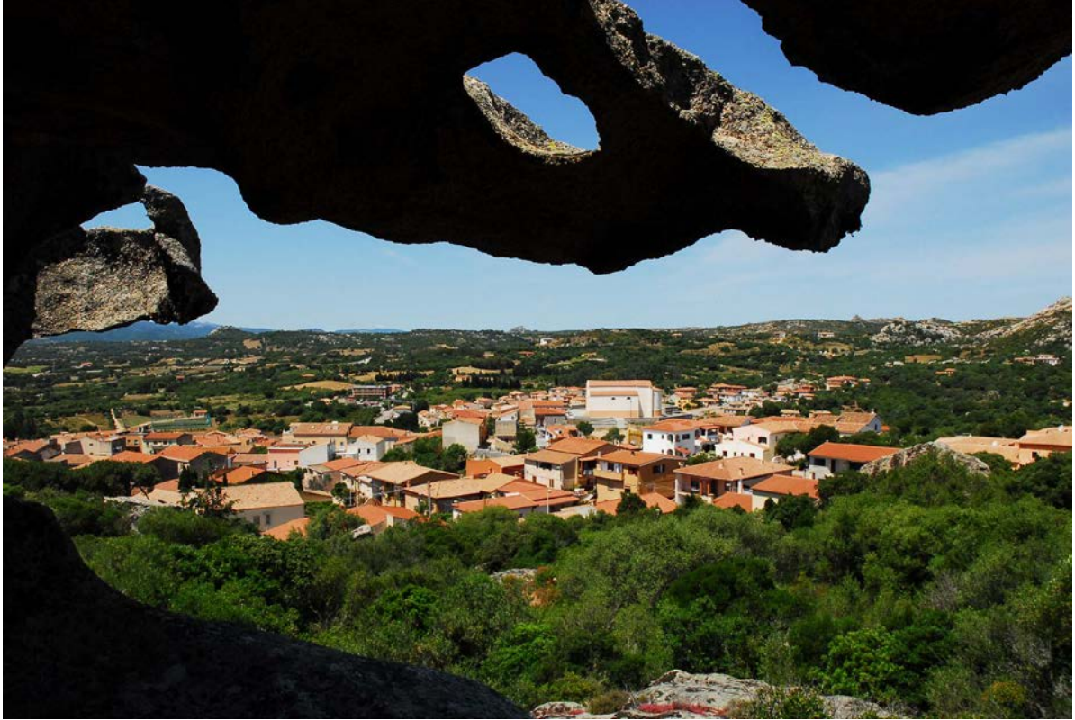
Fig. 4 - Arzachena, panorámica

En 1922, tras años de duras luchas, obtuvo la autonomía del Templo Pausania y desde entonces ha tenido un desarrollo urbanístico y demográfico continuo que aumentó en la década de 1960 por el boom turístico de la Costa Esmeralda (fig. 4).