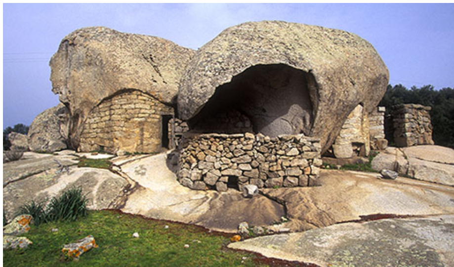
Fig. 2 - Taffoni en la localidad de Pilastru de Arzachena.

presentan grandes cavidades, que han servido y sirven para la recuperación del ganado» (fig. 2).