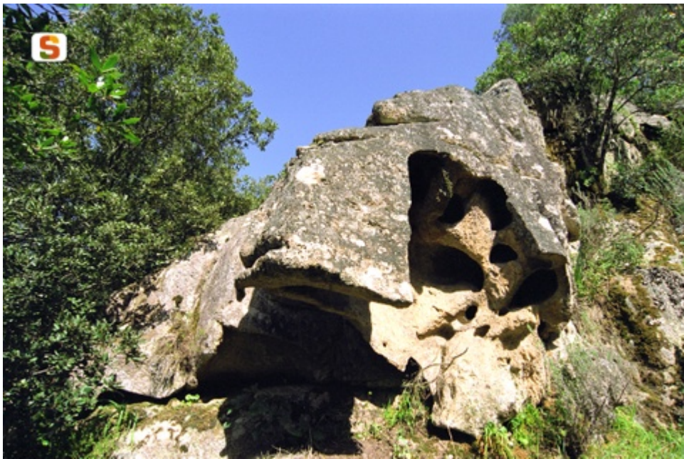
Fig. 1 - Limbara Norte, Taffone granítico en la localidad de Li Conchi

Los taffoni , término de origen corso para indicar las cavidades naturales del granito debido a la erosión, fueron muy comunes en paredes y bloques, a menudo eran de un gran tamaño y forman un elemento característico de todo el paisaje granítico de la Gallura (fig. 1).