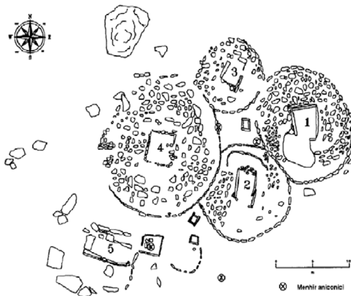
Fig. 1 Necropoli di Li Muri (Arzachena, SS). Planimetria.

En el V-IV milenio a.C., paralelamente con el uso de fosas para las inhumaciones, la cista lítica se difundió por Cataluña, Linguadoca, la Provenza y en el eje insular Córcega-Cerdeña. Este aspecto del megalitismo funerario que ha sido demostrado en la necrópolis de Li Muri (fig. 1), y que se remonta al Neolítico reciente sardo (3400-3200 a.C.), se llama protomegalitismo.