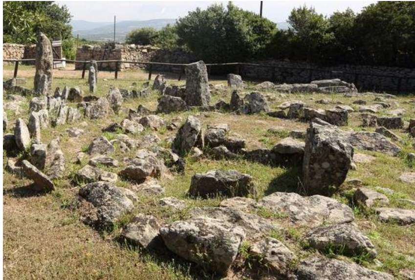
Fig. 2 - Arzachena, Necrópolis de Li Muri, cista lítica del círculo 4.

Antiguamente estaba dentro de un anillo de losas de granito clavadas verticalmente en el terreno, un peristalito de doble paramento, y sellada por un túmulo del que sólo ha sobrevivido la base de piedras.