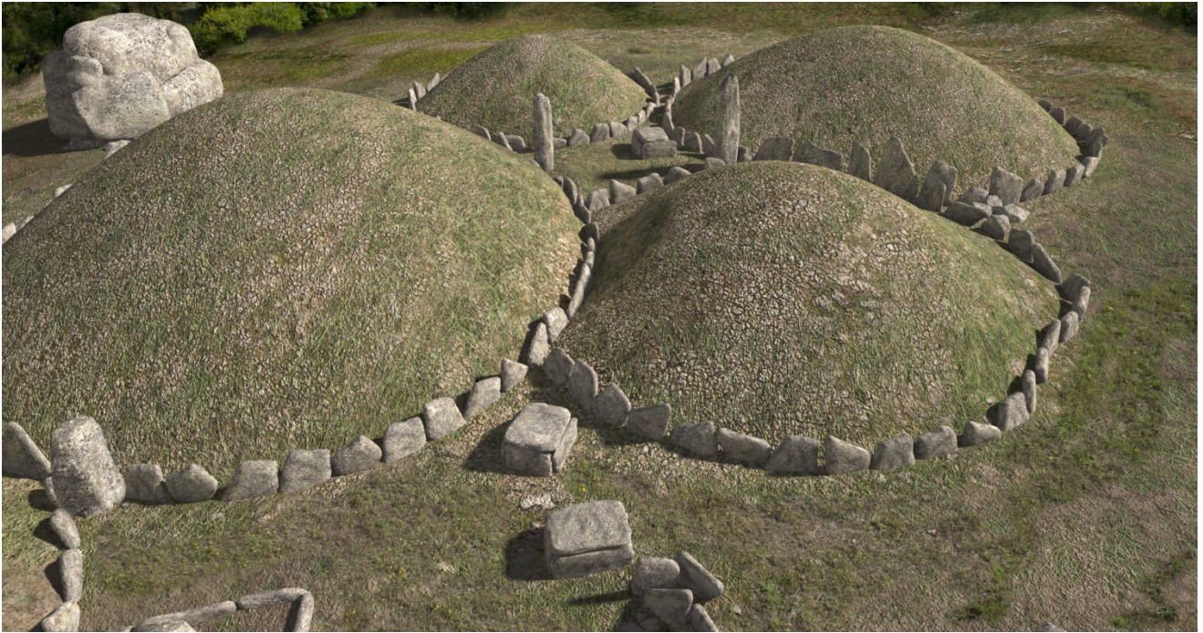
Fig. 3 - Render de los círculos funerarios.

La tumba circular nº 4 contenía cinco pomos esféricos que se han interpretado como objetos de poder del milenio III a.C., que se han hallado junto con unas pequeñas hachas líticas y elementos de piedra de collares.