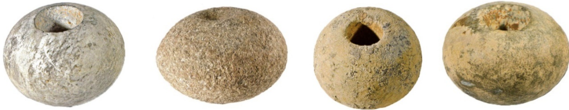
Figs. 4, 5, 6, 7 - Arzachena, Necrópolis de Li Muri, bolas de piedra (de Antona 2013 págs. 82-83).

La tumba circular nº 4 contenía cinco pomos esféricos que se han interpretado como objetos de poder del milenio III a.C., que se han hallado junto con unas pequeñas hachas líticas y elementos de piedra de collares.